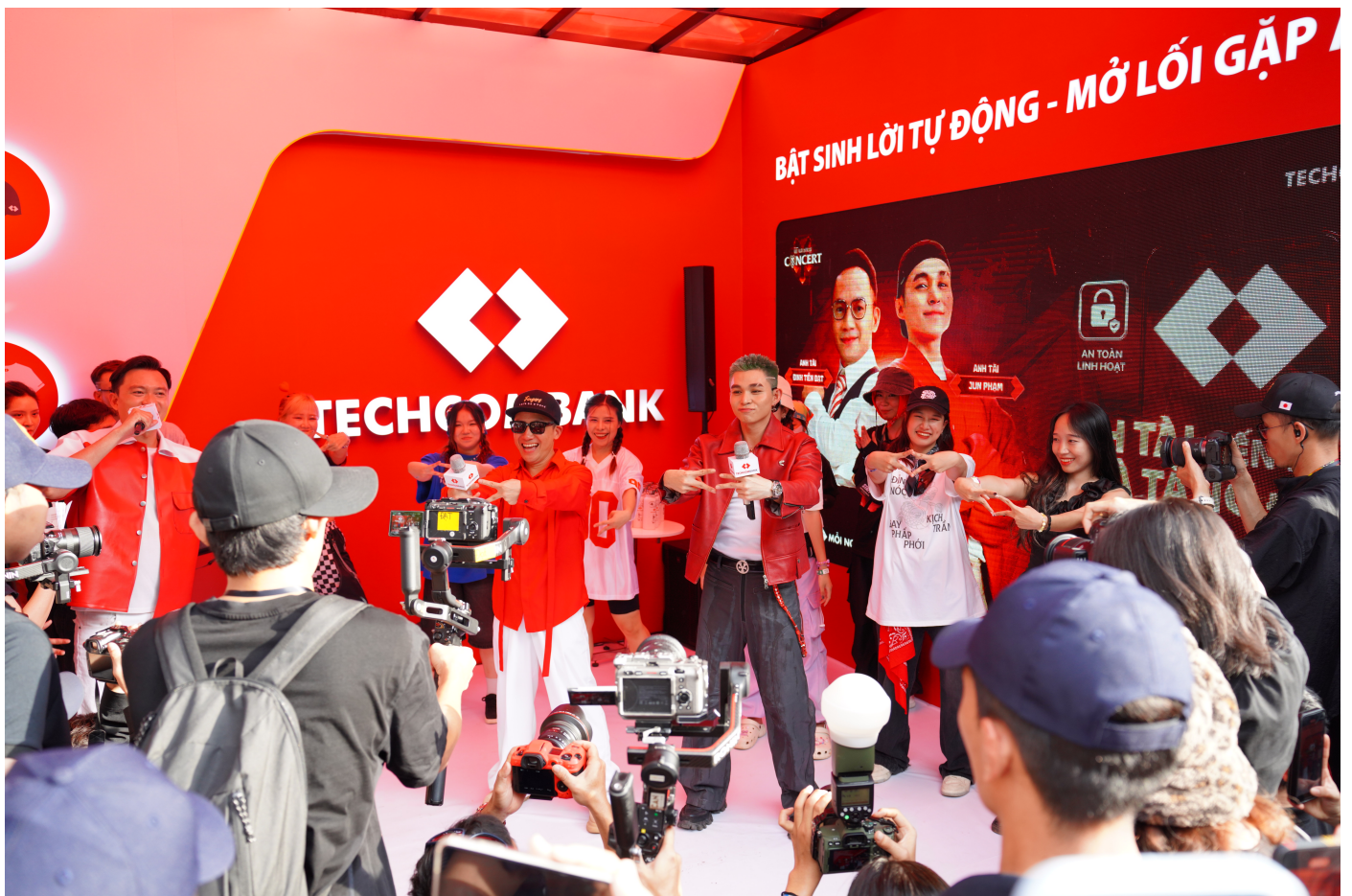
Bật Sinh lời tự động để “săn vé anh tài”.

Ngày 17/01/2025, Techcombank đã chính thức công bố cách thức “săn vé” đến concert, để người hâm mộ lại một lần đắm chìm trong âm nhạc và nghệ thuật đỉnh cao.