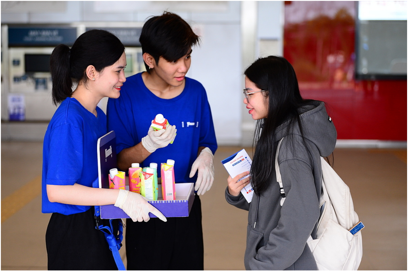
Trong khi đó, sữa tươi Vinamilk Green Farm được phục vụ cho hành khách tại ga nhà hát thành phố