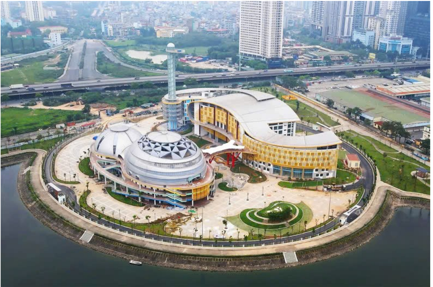
Cung Thiếu nhi Hà Nội hiện đại nhất cả nước.

Hai công trình tiêu biểu trong nhiều công trình trọng điểm của thành phố được gắn biển nhân dịp kỷ niệm 70 năm Ngày Giải phóng Thủ đô. Cung Thiếu nhi Hà Nội hiện đại nhất cả nước với nhà hát, rạp phim và các câu lạc bộ nghệ thuật có tổng diện tích gần 40.000m 2 khánh thành ngày 21/9/2024 và đưa vào sử dụng đáp ứng nhu cầu học tập vui chơi, thi đấu thể thao, rèn luyện thể chất, giao lưu văn hóa của thiếu nhi. Bệnh viện Nhi Hà Nội với quy mô giai đoạn 1 là 200 giường bệnh, chính thức đi vào hoạt động từ ngày 9/10/2024, kỳ vọng giảm tải cho Bệnh viện Nhi Trung ương, đáp ứng tốt hơn nhu cầu chăm sóc sức khỏe trẻ em, Nhân dân Thủ đô, các tỉnh lân cận.