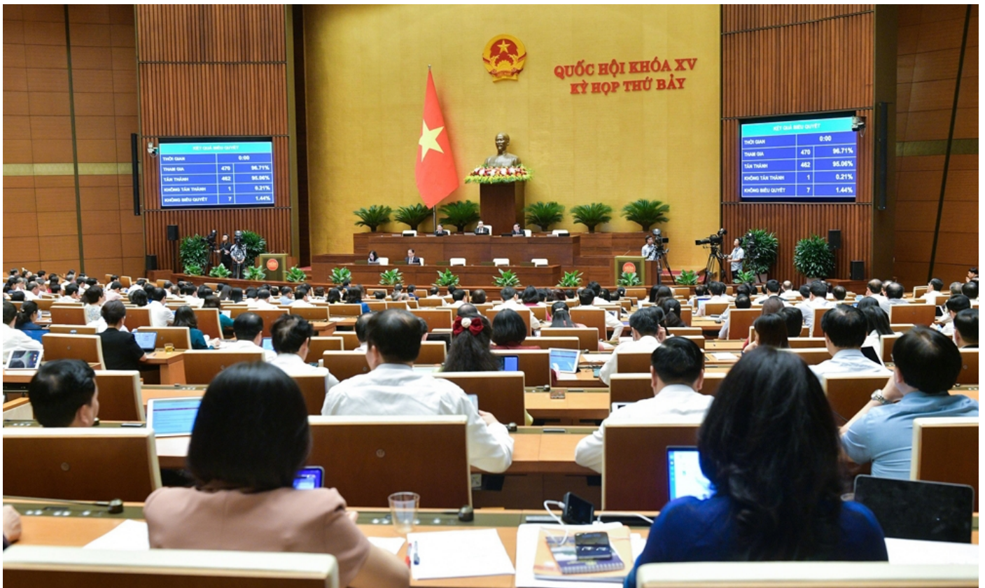
Quốc hội thông qua Luật Thủ đô (sửa đổi).

Ngày 28/6/2024, Quốc hội thông qua Luật Thủ đô (sửa đổi) với cơ chế, chính sách đặc thù vượt trội. Luật tạo cơ sở pháp lý quan trọng để Thủ đô phát huy quyền tự chủ, tháo gỡ các nút thắt trong quản lý, huy động nguồn lực, thu hút nhân tài, thúc đẩy đổi mới sáng tạo, phát triển bền vững... Đây là cơ sở pháp lý để thành phố Hà Nội thực hiện các nhiệm vụ chiến lược đã được xác định tại Nghị quyết 15-NQ/TW của Bộ Chính trị, hướng tới mục tiêu.