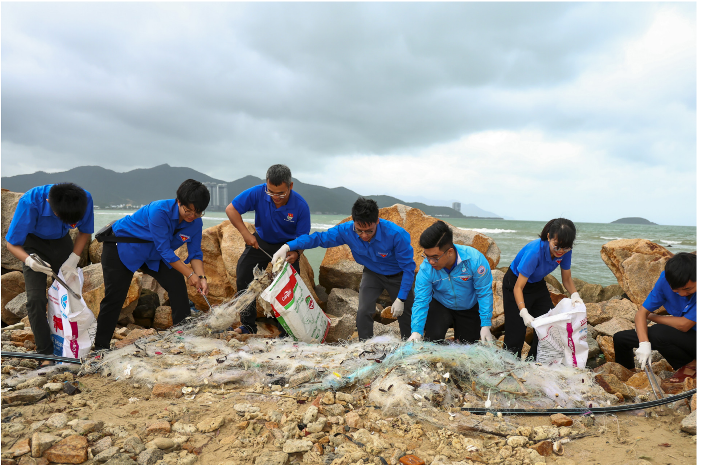
Đoàn viên tham gia làm sạch bãi biển

Hoạt động thu gom rác thải, làm sạch bãi biển, tuyên truyền giữ gìn vệ sinh môi trường biển với chủ đề “Lan tỏa tình yêu biển, đảo” đã thu gom được hơn 2 tấn rác thải, được xử lý theo quy định.