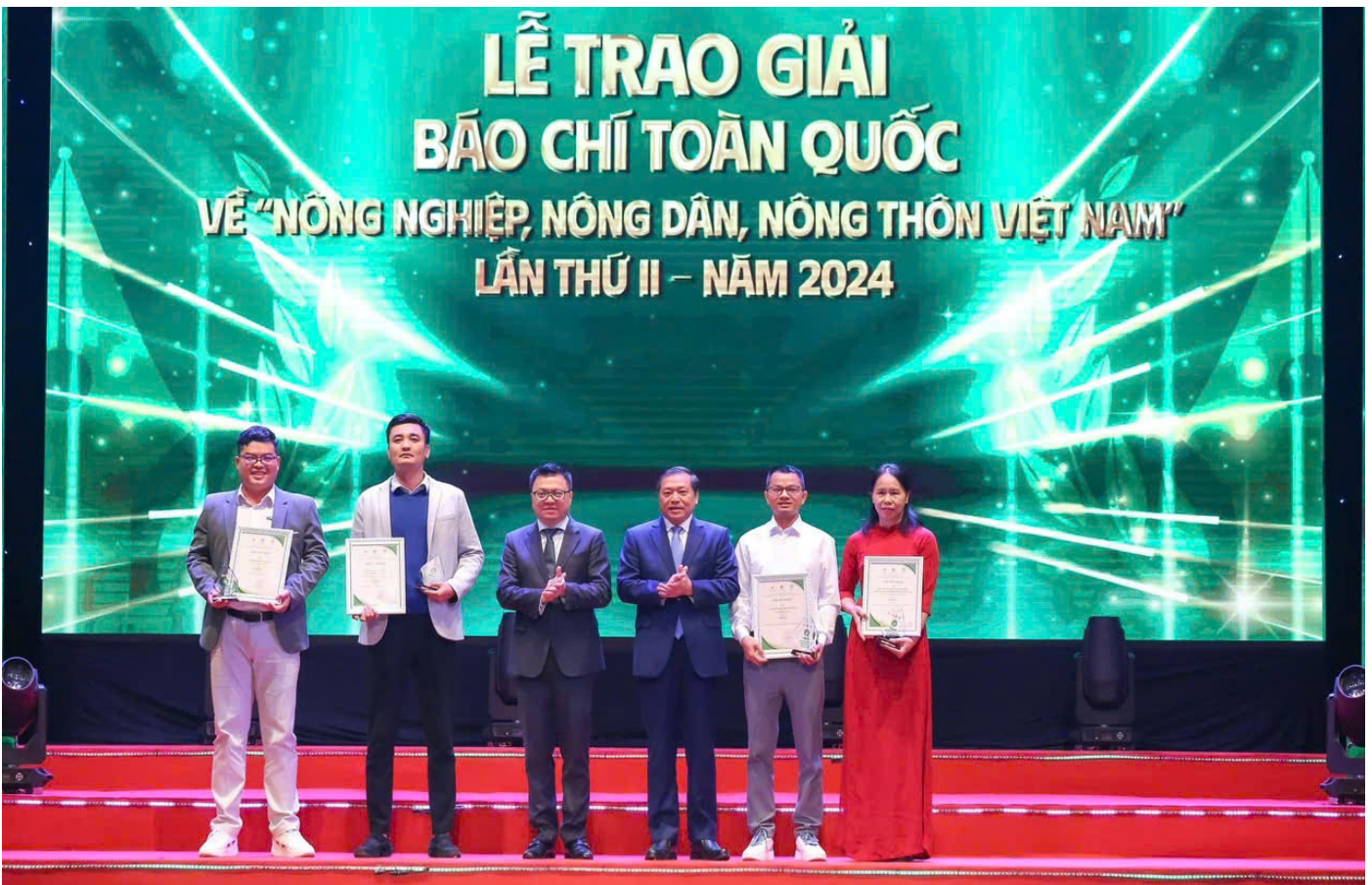
Ban Tổ chức trao giải B cho các tác giả