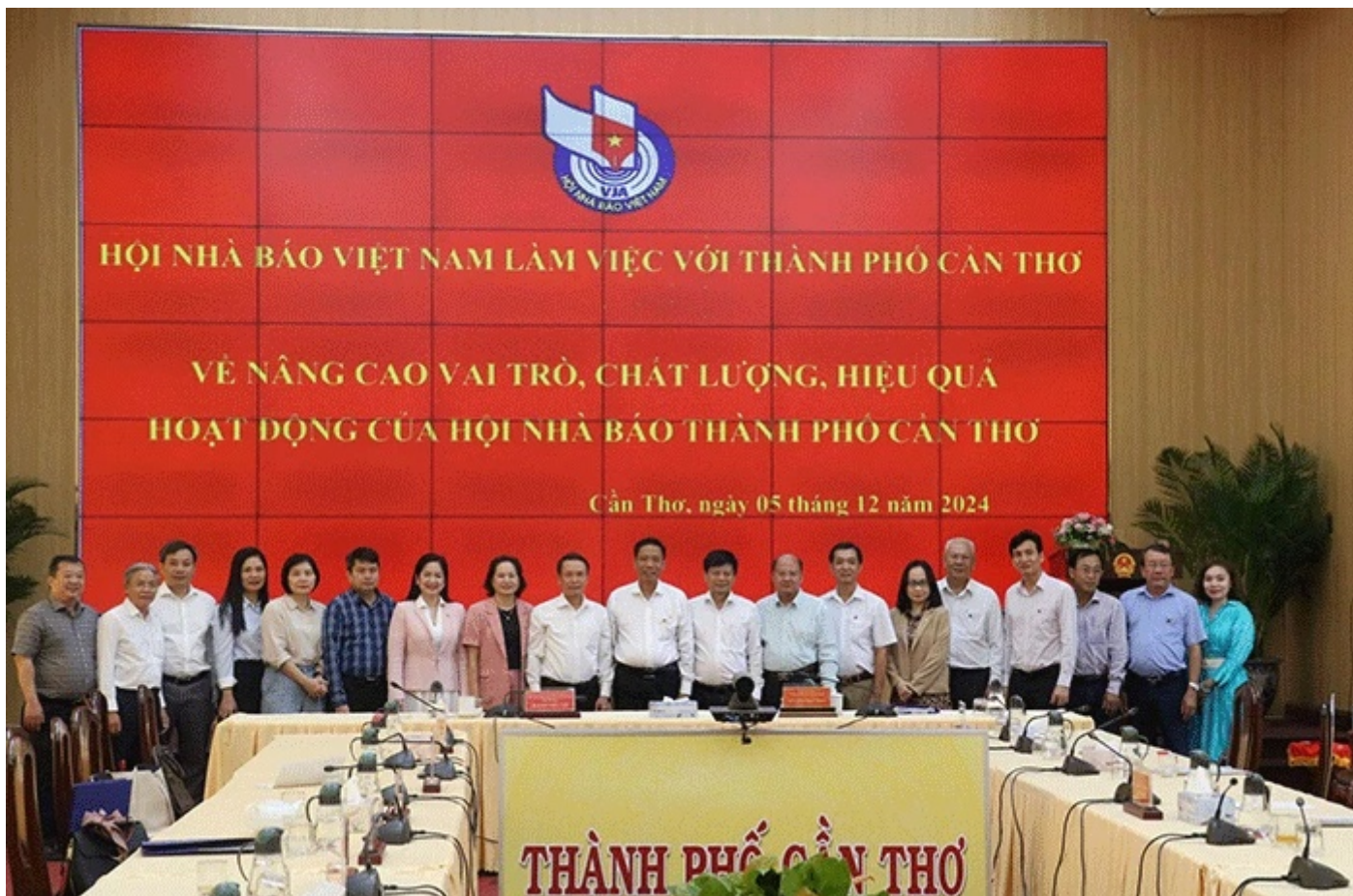
Đoàn công tác của Hội Nhà báo Việt Nam chụp ảnh lưu niệm với lãnh đạo thành phố Cần Thơ