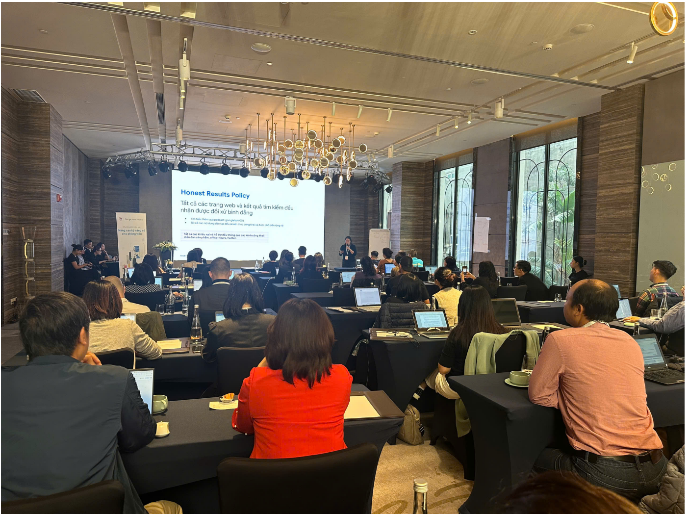
Quang cảnh toàn hội nghị

Ngày 27/11, Hội Nhà báo Việt Nam, Trung tâm Bồi dưỡng nghiệp vụ báo chí, Hội Nhà báo Việt Nam phối hợp với Google News Initiative tổ chức chương trình đào tạo: “nâng cao kỹ năng số cho phóng viên”.