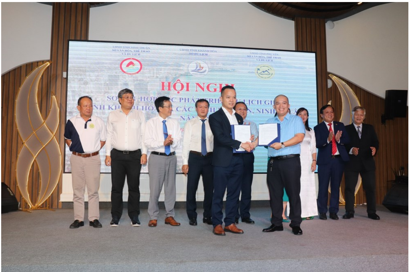
Doanh nghiệp các địa phương ký kết hợp tác phát triển du lịch

Đặc biệt, trong khuôn khổ chương trình, các doanh nghiệp du lịch Khánh Hòa, Phú Yên, Ninh Thuận đã ký kết hợp tác phát triển du lịch.