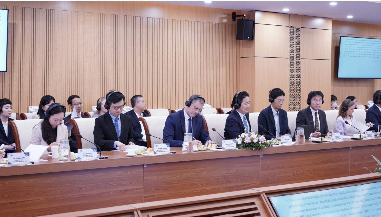
Các đại biểu tham dự hội thảo.

Tại hội thảo, các đại biểu đã thảo luận, đánh giá về các thành tựu nổi bật của ngành BHXH Việt Nam trong 30 năm xây dựng và trưởng thành. Những thành tựu nổi bật và ấn tượng của ngành BHXH Việt Nam, nhất là sự phát triển, bao phủ BHXH, BHYT là kết quả của sự cố gắng, nỗ lực không ngừng phấn đấu, vươn lên của toàn ngành, kiên trì vượt qua khó khăn, thách thức để thực hiện sứ mệnh là trụ cột an sinh xã hội.