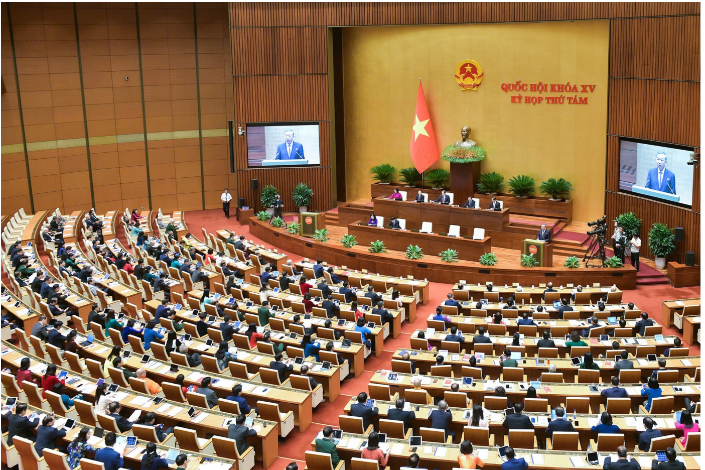
Tổng Bí thư, Chủ tịch nước Tô Lâm phát biểu tại phiên khai mạc Kỳ họp thứ 8 Quốc hội khóa XV