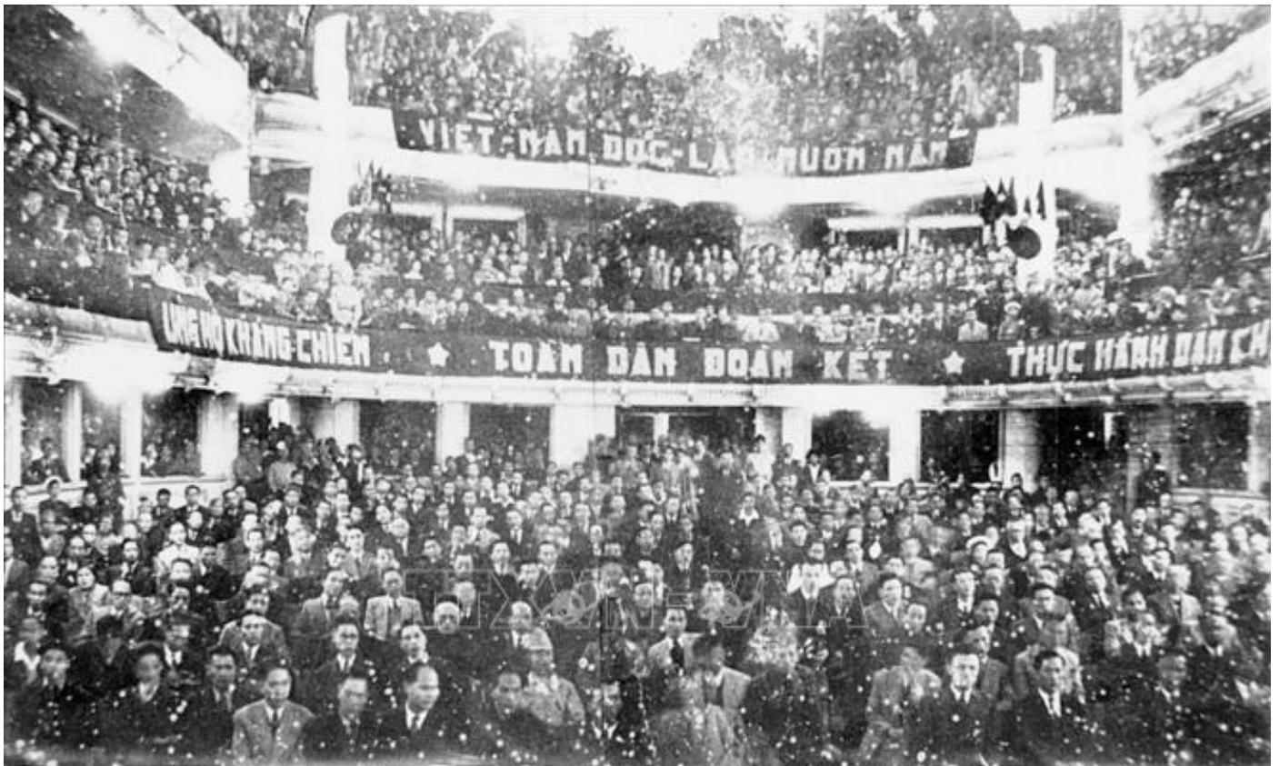
Quang cảnh buổi khai mạc kỳ họp thứ nhất, Quốc hội khoá I, ngày 2/3/1946_ Ảnh: Tư liệu.

Gần 80 năm đồng hành cùng đất nước, Quốc hội - cơ quan đại biểu cao nhất của Nhân dân, cơ quan quyền lực nhà nước cao nhất của nước Cộng hòa xã hội chủ nghĩa Việt Nam đã thể hiện vai trò đặc biệt quan trọng trong cải cách thể chế. Thông qua việc thực hiện các chức năng lập hiến, lập pháp, quyết định các vấn đề quan trọng của đất nước và giám sát tối cao, Quốc hội từng bước tạo lập các cơ sở pháp lý quan trọng, vững chắc cho công cuộc đổi mới toàn diện đất nước mà trọng tâm là xây dựng Nhà nước pháp quyền xã hội chủ nghĩa của Nhân dân, do Nhân dân, vì Nhân dân, xây dựng, phát triển nền kinh tế thị trường định hướng xã hội chủ nghĩa, bảo đảm quốc phòng - an ninh, tôn trọng, bảo đảm, bảo vệ quyền con người, quyền công dân và hội nhập quốc tế.