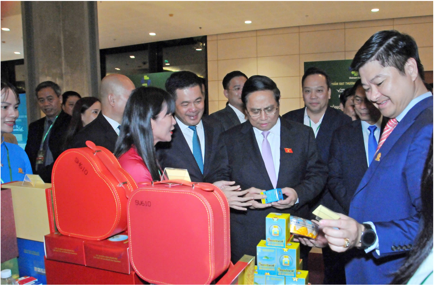
Thủ tướng Phạm Minh Chính tham quan gian hàng Yến sào Khánh Hoà

Với những nỗ lực trong hoạt động sản xuất kinh doanh, Công ty Yến sào Khánh Hòa đã luôn hoàn thành kế hoạch chỉ tiêu nhà nước giao, doanh thu, nộp ngân sách tăng cao hàng năm, thu nhập của CBCNV được nâng cao rõ rệt, giải quyết nhiều việc làm cho người lao động tại địa phương đã tạo sự chuyển biến tích cực, nâng cao hiệu quả trong sản xuất kinh doanh và xây dựng đơn vị vững mạnh, là một trong những đơn vị kinh tế chủ lực góp phần đáng kể vào sự nghiệp phát triển kinh tế.