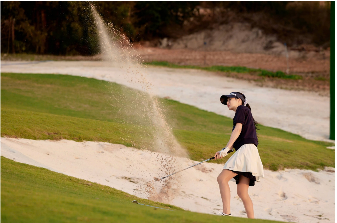
Một nữ golfer thực hiện cú đánh đầy uy lực từ bunker tại Eschuri Vung Bau Golf

Mới đây, SBS Golf Channel, Truyền hình quốc gia Hàn Quốc và Tạp chí Hankyung giới thiệu Eschuri Vung Bau Golf như một điểm đến golf yêu thích mới của du khách Hàn Quốc. Kênh truyền hình không tiếc lời giới thiệu “một trong những sân golf ấn tượng nhất tại Việt Nam”, thu hút cả những golfer thủ chuyên nghiệp nhất với độ khó và tính thử thách cao.