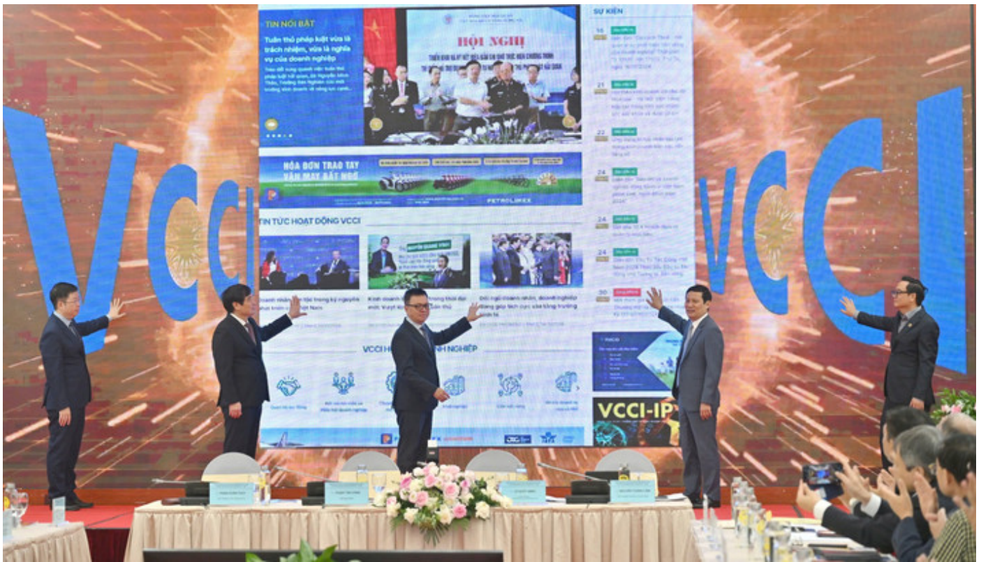
Các đại biểu bấm nút khai trương giao diện mới cho Trang thông tin điện tử của Liên đoàn Thương mại và Công nghiệp Việt Nam.