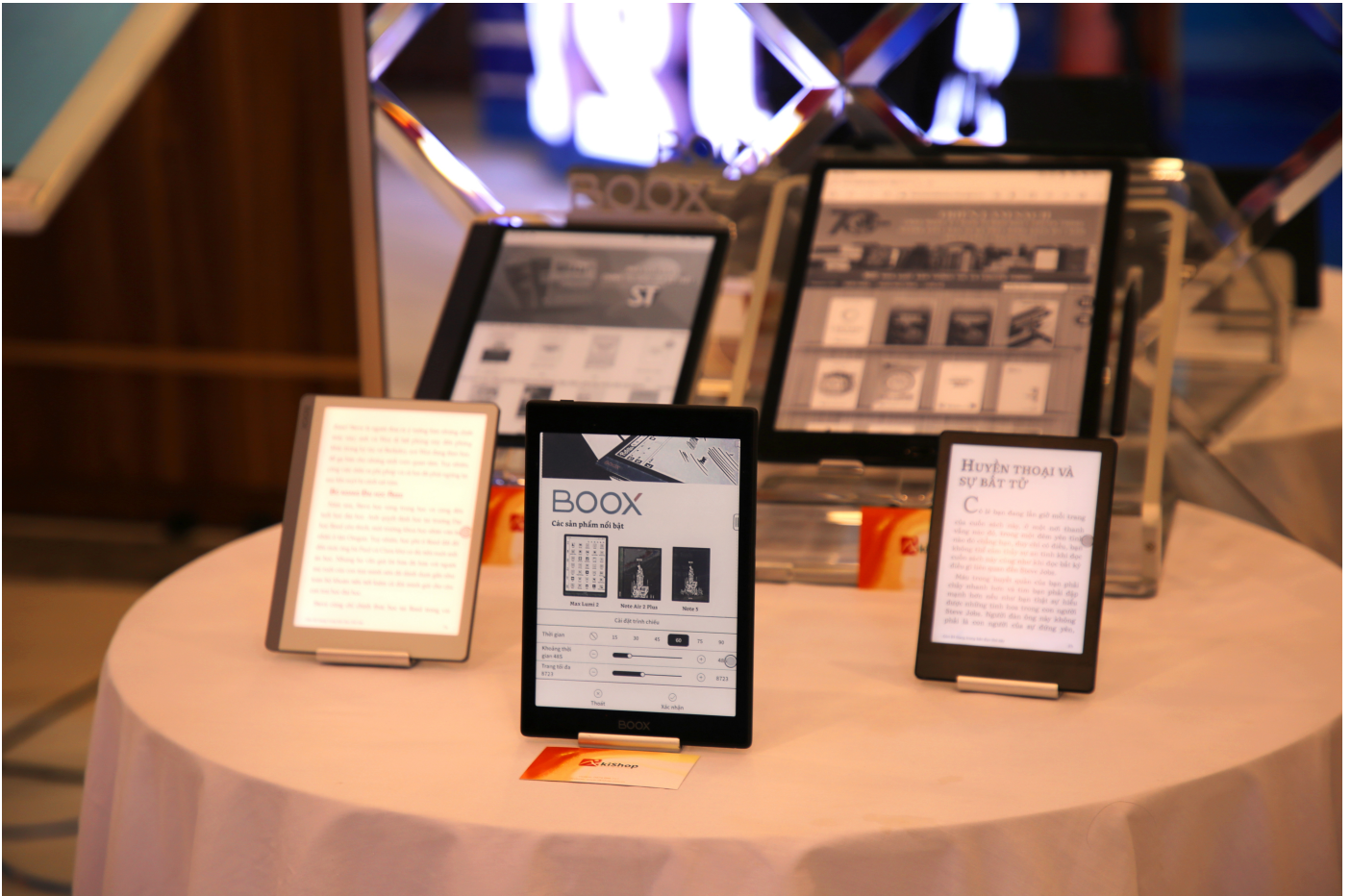
Ảnh: minh họa

Yêu cầu đối với nhân sự xuất bản trong tình hình mới