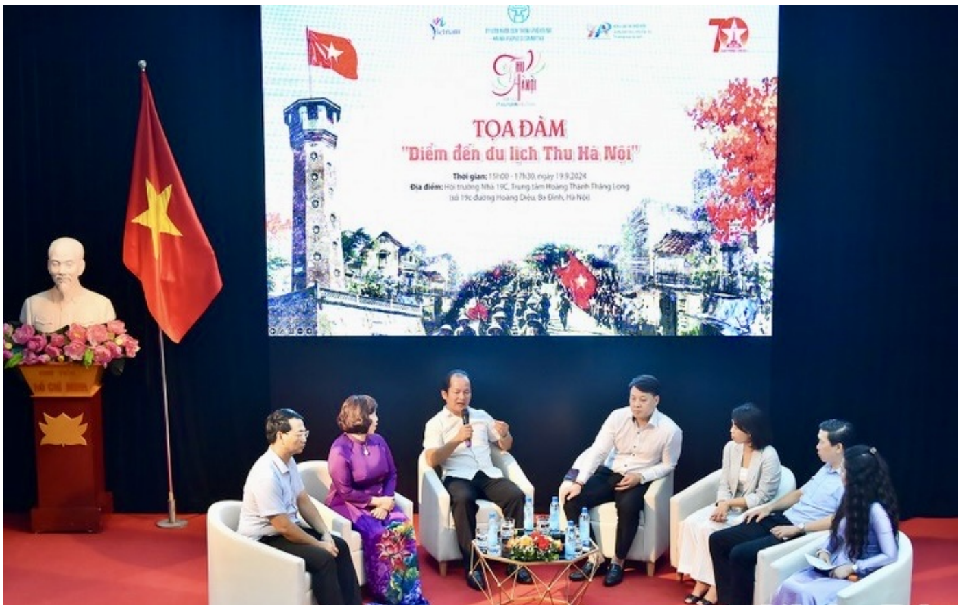
Tọa đàm “Điểm đến du lịch Thu Hà Nội”.