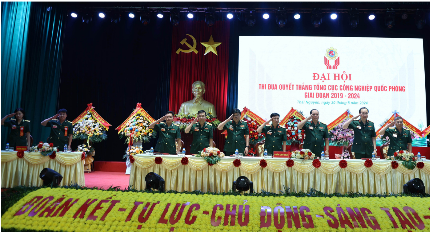
Đoàn chủ tịch điều hành đại hội.