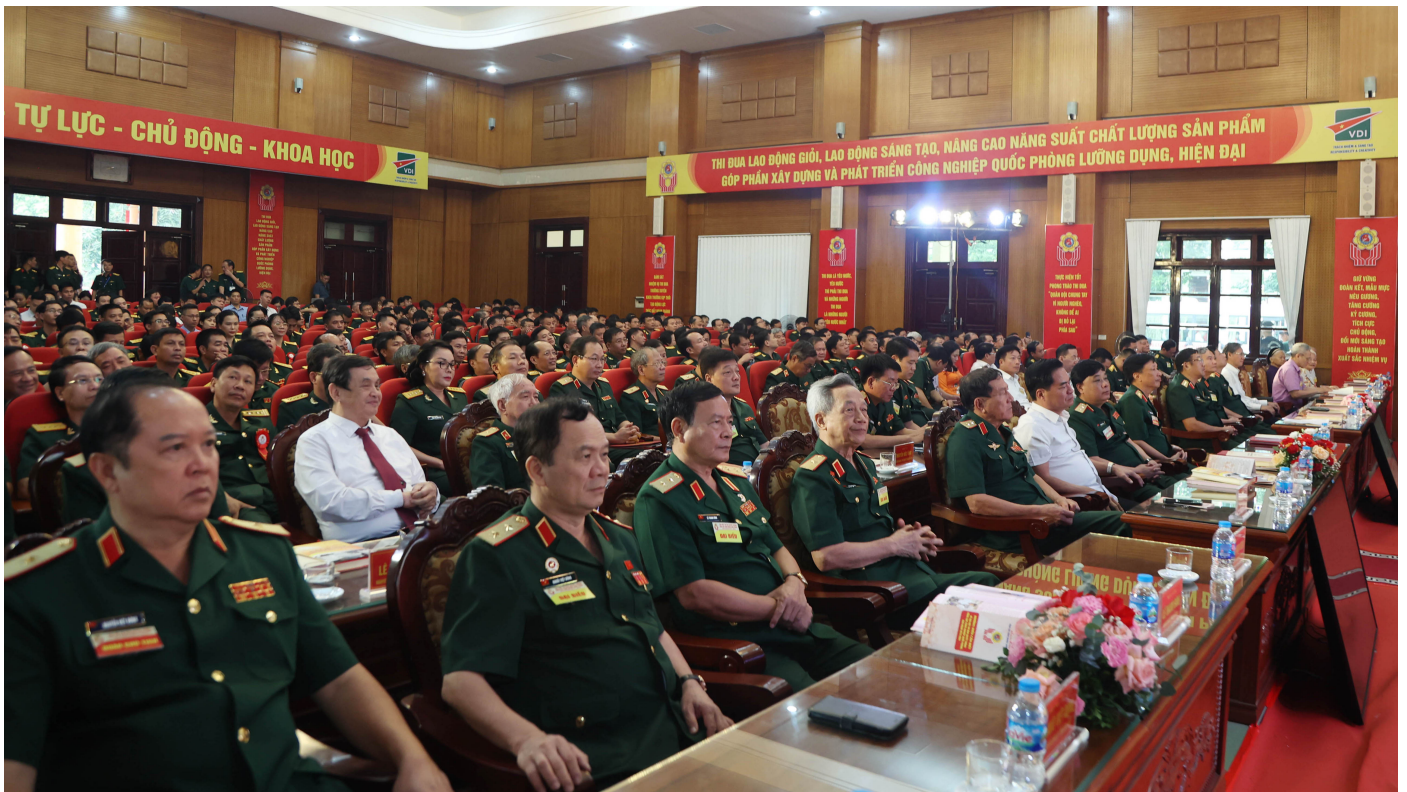
Quang cảnh đại hội thi đua quyết thắng Tổng cục Công nghiệp Quốc phòng giai đoạn 2019-2024.