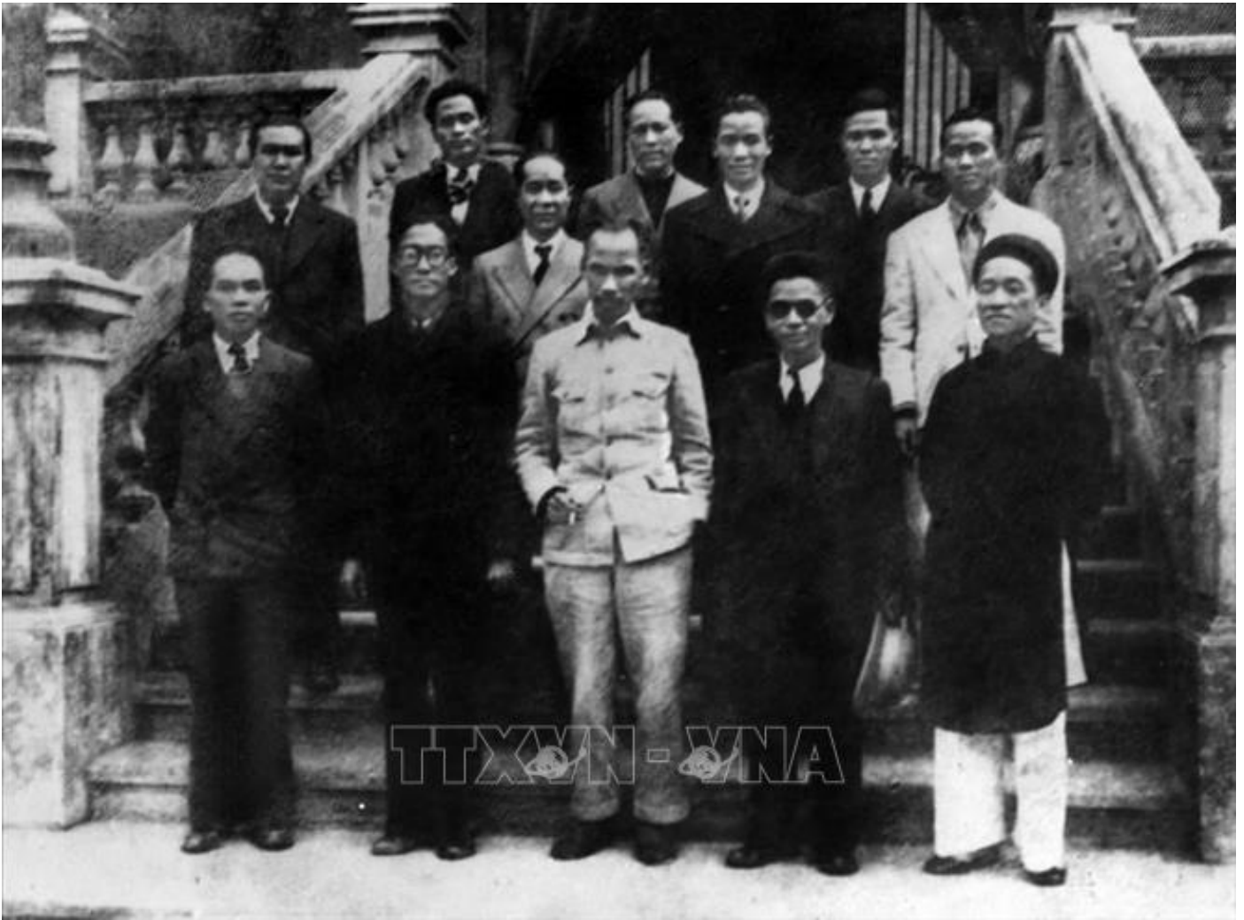
Chủ tịch Hồ Chí Minh và các thành viên Hội đồng Chính phủ lâm thời nước Việt Nam Dân chủ Cộng hòa ra mắt sau phiên họp đầu tiên, sáng 3/9/1945

Cách mạng tháng Tám đã mở ra một kỷ nguyên mới: Kỷ nguyên giải phóng dân tộc gắn liền với giải phóng giai cấp công nhân và nhân dân lao động, kỷ nguyên độc lập dân tộc gắn liền với chủ nghĩa xã hội. Đây thực sự là bước nhảy vọt trong lịch sử phát triển của dân tộc Việt Nam. Không chỉ là mốc son chói lọi trong lịch sử dân tộc Việt Nam, Cách mạng tháng Tám 1945 còn là sự kiện mang tầm vóc thời đại, có ý nghĩa quốc tế sâu sắc. Lần đầu tiên trong lịch sử có một dân tộc nhỏ bé đã tự đấu tranh giải phóng khỏi ách đế quốc thực dân. Đây là nguồn cổ vũ, động viên to lớn đối với các dân tộc thuộc địa, nhân dân bị áp bức, bóc lột trên thế giới đấu tranh giành độc lập dân tộc, dân chủ và tiến bộ xã hội.