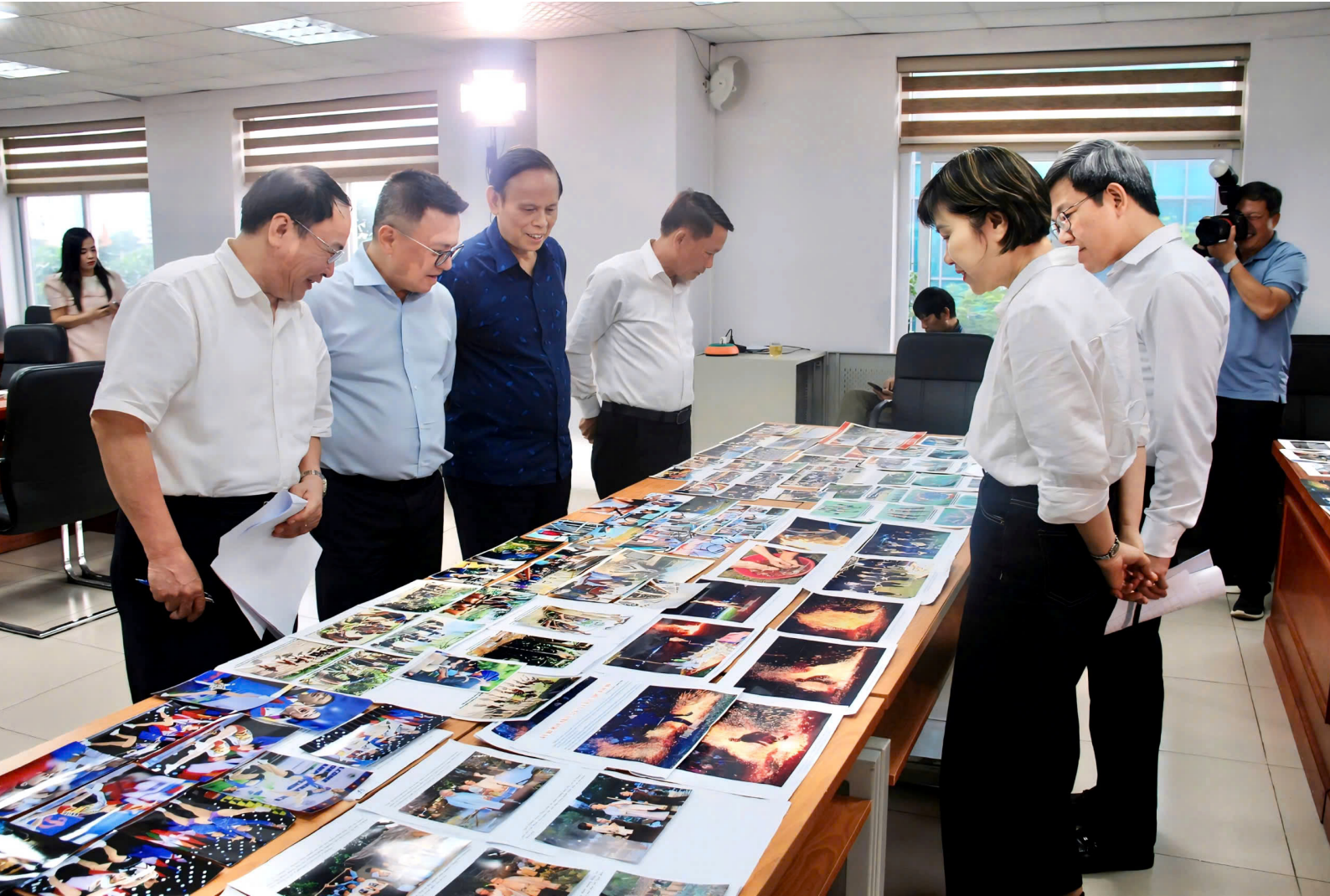
Các thành viên Hội đồng cùng thảo luận.

Bên cạnh đó, cần tăng cường công tác truyền thông về nội dung giải đến các cơ quan báo chí, các cấp hội nhà báo nhất là các địa phương khu vực miền Trung - Tây Nguyên để khuyến khích gửi tác phẩm dự thi cho các mùa giải tiếp theo.