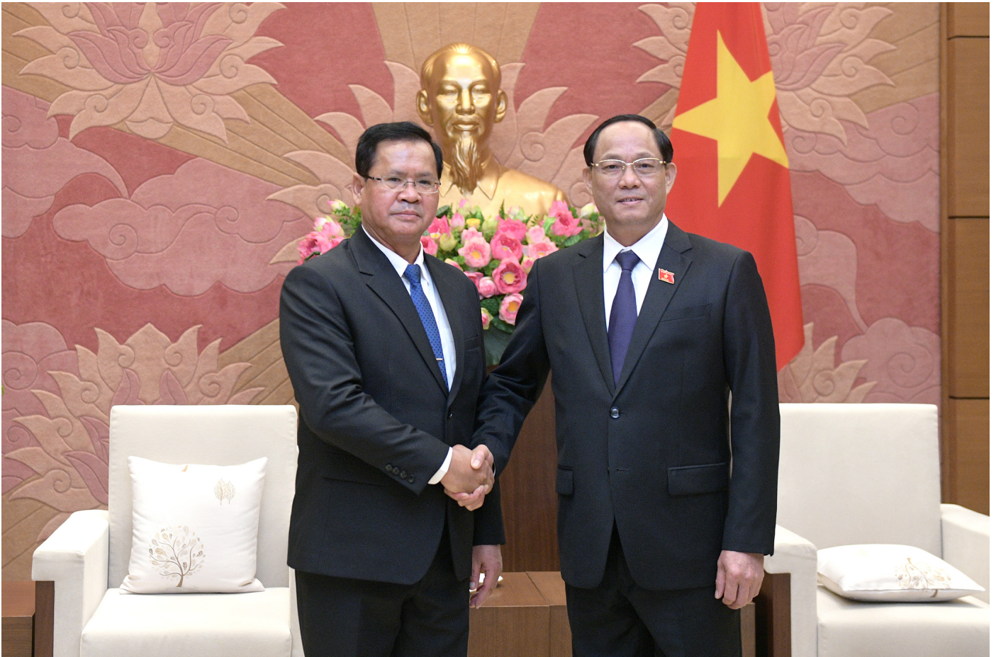
Phó Chủ tịch Quốc hội Trần Quang Phương tiếp Chủ nhiệm Ủy ban Quốc phòng và An ninh của Quốc hội Lào Vongsack Phanthavong.

Vui mừng chào đón Chủ nhiệm Ủy ban Quốc phòng và An ninh của Quốc hội Lào Vongsack Phanthavong đến thăm và làm việc tại Việt Nam, Phó Chủ tịch Quốc hội Trần Quang Phương đánh giá cao kết quả cuộc hội đàm giữa Ủy ban Quốc phòng và An ninh của Quốc hội Việt Nam và Ủy ban Quốc phòng và An ninh của Quốc hội Lào.