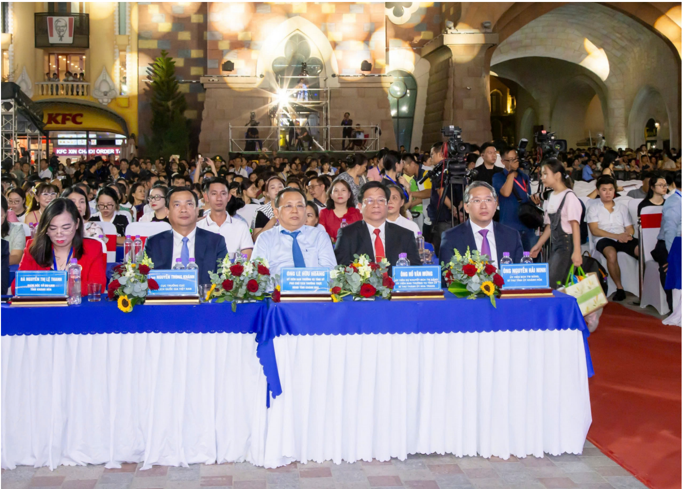
Các đại biểu tham dự chương trình

Ngày 3/8, tại TP. Nha Trang, đã diễn ra chương trình bế mạc Lễ hội Vịnh ánh sáng quốc tế Nha Trang 2024.