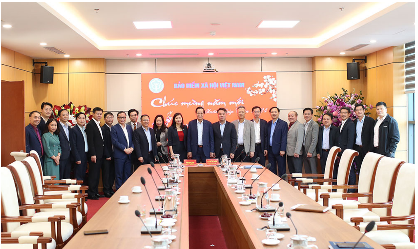
Đại diện hai ngành chụp ảnh kỷ niệm.

“Hai ngành phải đồng hành, tăng cường công tác phối hợp vì lợi ích chung của người tham gia, thụ hưởng chính sách BHXH. Để Luật BHXH sửa đổi được thông qua với những nội dung tiến bộ, đột phá nhất, với tầm nhìn và hiệu quả hơn”, Bộ trưởng Đào Ngọc Dung nhấn mạnh.