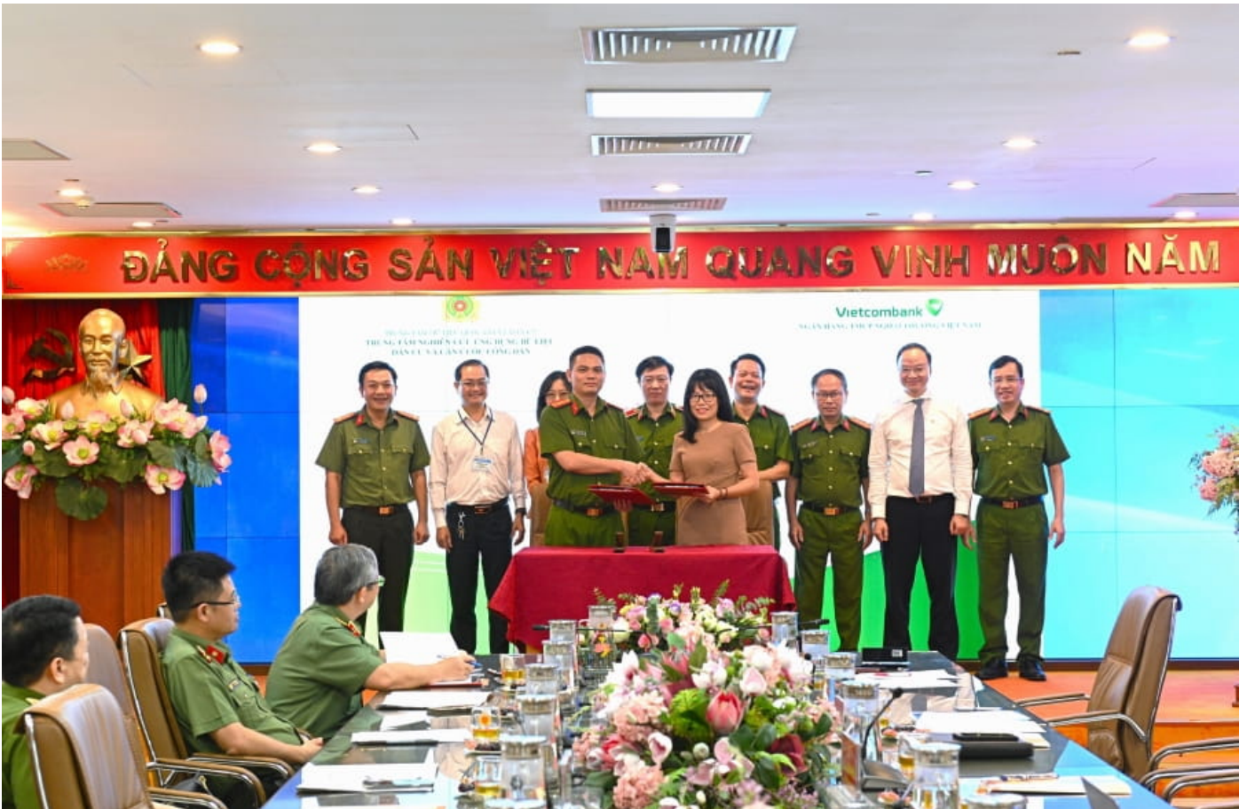
Hình ảnh lễ ký kết “Dịch vụ xác thực điện tử” giữa đại diện Bộ Công an và Vietcombank.

“Mặc dù chỉ trong thời gian rất ngắn, nhưng chúng tôi đã có hơn 3 triệu khách hàng đăng ký sinh trắc học thành công và vẫn đang tăng nhanh, thuộc nhóm đầu thị trường theo thống kê của Ngân hàng Nhà nước. Điều này có được là do Vietcombank đã chủ động triển khai nhiều kênh, nhiều phương thức để khách hàng đăng ký bao gồm: đăng ký online sử dụng công nghệ “quét” NFC; đăng ký online sử dụng kết nối App-to-App với tài khoản định danh điện tử (VNeID); đăng ký tại gần 400 điểm giao dịch trên toàn quốc. Rất nhiều điểm giao dịch của Vietcombank đã làm việc ngoài giờ và làm thêm vào cuối tuần để hỗ trợ khách hàng đăng ký thông tin”.