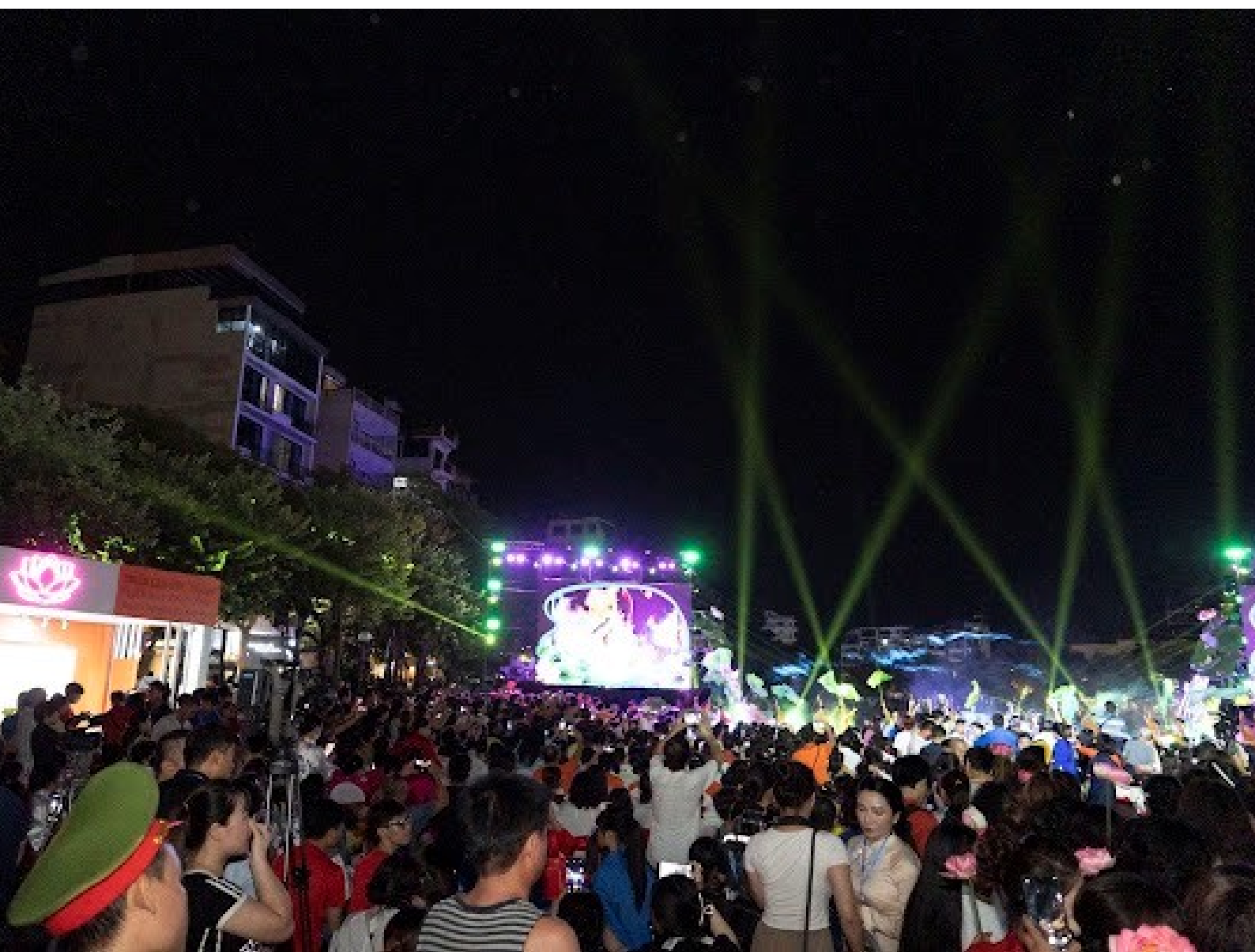
Quang cảnh lễ khai mạc lễ hội Sen Hà Nội 2024.

Lễ hội sen Hà Nội năm 2024 lần đầu tiên được tổ chức tại không gian văn hóa sáng tạo Tây Hồ (quận Tây Hồ, Hà Nội) từ ngày 12 đến ngày 16/7/2024. Lễ hội giới thiệu nhiều sản phẩm từ sen, các sản phẩm OCOP gắn với văn hóa các tỉnh miền núi phía Bắc, với nhiều hoạt động hấp dẫn, đặc sắc nhằm tôn vinh và khẳng định giá trị của cây sen trong phát triển kinh tế và đời sống tinh thần của người dân.