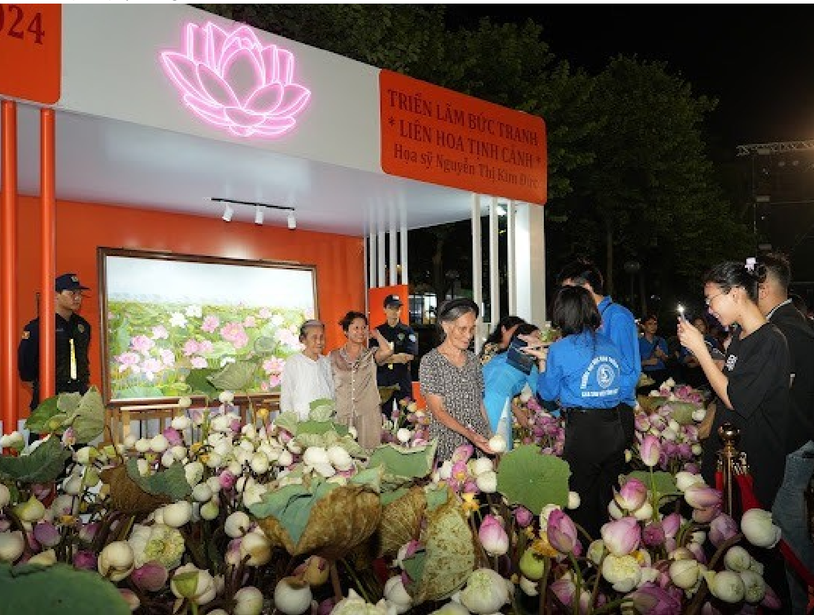
Các cụ già và thanh niên háo hức “check in” tại lễ hội.

văn hóa sen trong đời sống của người Hà Nội nói riêng, người Việt Nam nói chung. Đồng thời đây cũng là dịp để quảng bá và kích cầu du lịch, khơi dậy tiềm năng phát triển các sản phẩm OCOP của các địa phương; thu hút du khách đến tham quan Hà Nội, Tây Hồ, góp phần phát triển kinh tế, du lịch địa phương.