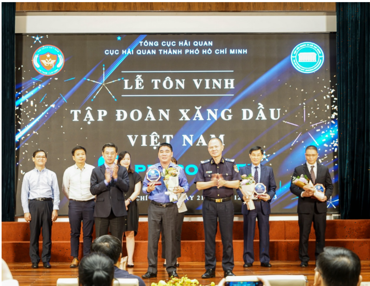
Đại diện Petrolimex nhận Kỷ niệm chương của Cục Hải quan TP. Hồ Chí Minh

Tuân thủ lộ trình áp dụng tiêu chuẩn khí thải của chính phủ, Petrolimex tiên phong kinh doanh các mặt hàng nhiên liệu chất lượng cao tiêu chuẩn Euro IV và V bao gồm: Xăng RON 95-IV, Dầu DO 0,001S-V, Xăng RON 95-V, góp phần tiết giảm đáng kể lượng khí thải do các xe cơ giới sử dụng nhiên liệu thải ra môi trường. Bằng việc lựa chọn các sản phẩm sạch, chất lượng cao, Petrolimex đã tiết giảm đáng kể lượng khí thải ra môi trường. Dự kiến từ năm 2025, sau khi tiêu chuẩn Euro 6 và thậm chí Euro 7 được ban hành, Tập đoàn sẽ đưa những dòng sản phẩm khí thải thấp này vào hệ thống kinh doanh. Mục tiêu chiến lược của Tập đoàn đến 2025, tầm nhìn 2035 “Trở thành tập đoàn năng lượng đứng đầu Việt Nam về những sản phẩm năng lượng xanh, sạch, chất lượng cao, thân thiện với môi trường dựa trên nền tảng công nghệ 4.0 và chuyển đổi số toàn diện”.