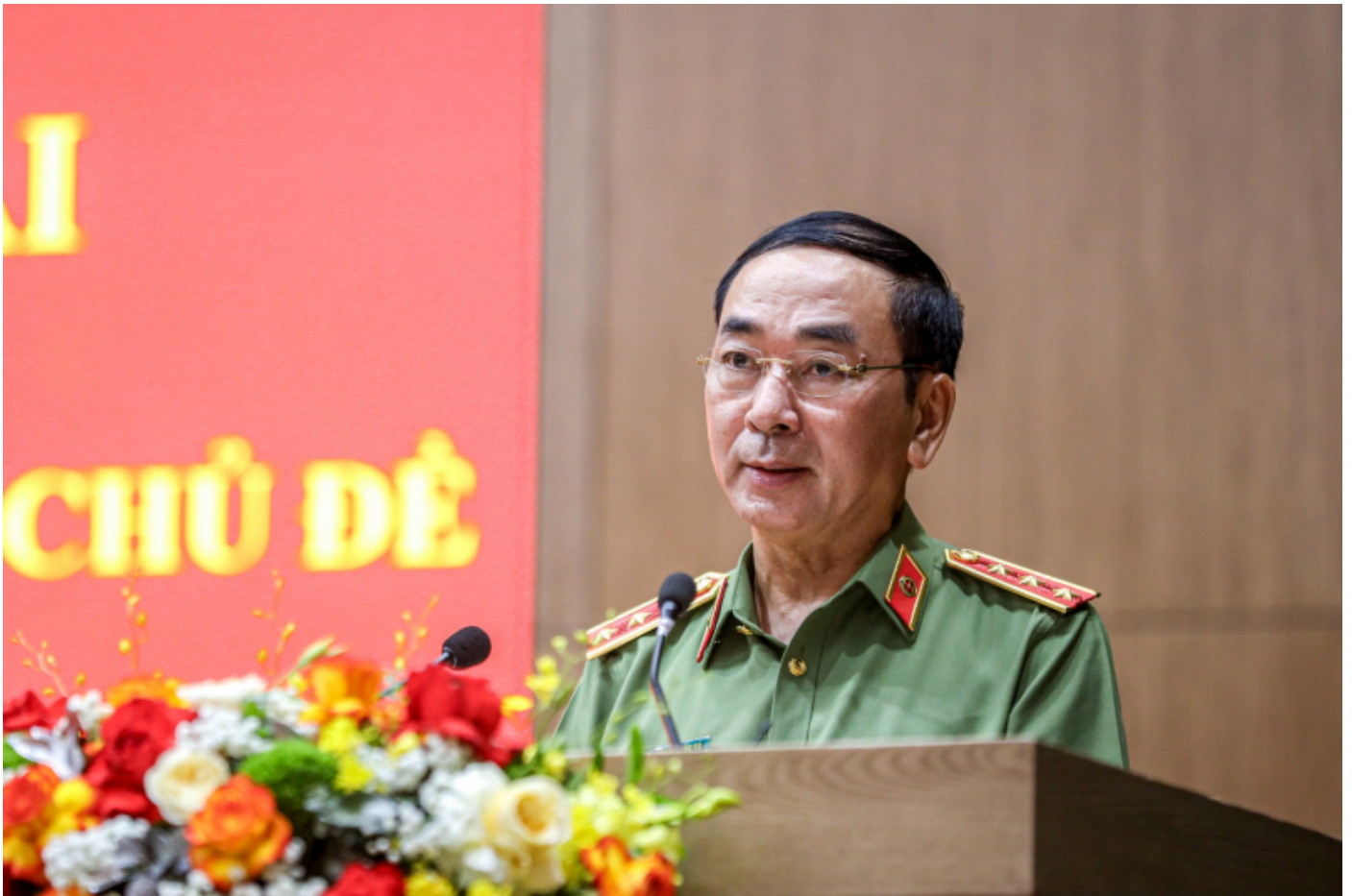
Thượng tướng Trần Quốc Tỏ, Ủy viên Trung ương Đảng, Phó Bí thư Đảng ủy Công an Trung ương, Thứ trưởng điều hành hoạt động của Bộ Công An phát biểu.

Sau một năm phát động, Ban Tổ chức đã nhận được nhiều tác phẩm của các cá nhân, tập thể, đơn vị, địa phương gửi tham dự. Nhiều bài dự thi có chất lượng cao, phản ánh khá toàn diện về hình tượng, thực tiễn công tác, chiến đấu, những kết quả, thành tích, chiến công của lực lượng công an tại cơ sở "gần dân, hiểu dân", "vì bình yên và hạnh phúc của nhân dân"... với nhiều tấm gương Công an xã, phường, thị trấn, gương người tốt, việc tốt, điển hình tiêu biểu trong học tập và làm theo Sáu điều Bác Hồ dạy CAND; không quản ngại khó khăn, tận tụy "vì nước quên thân, vì dân phục vụ", anh dũng hy sinh để bảo vệ tính mạng, tài sản người dân.