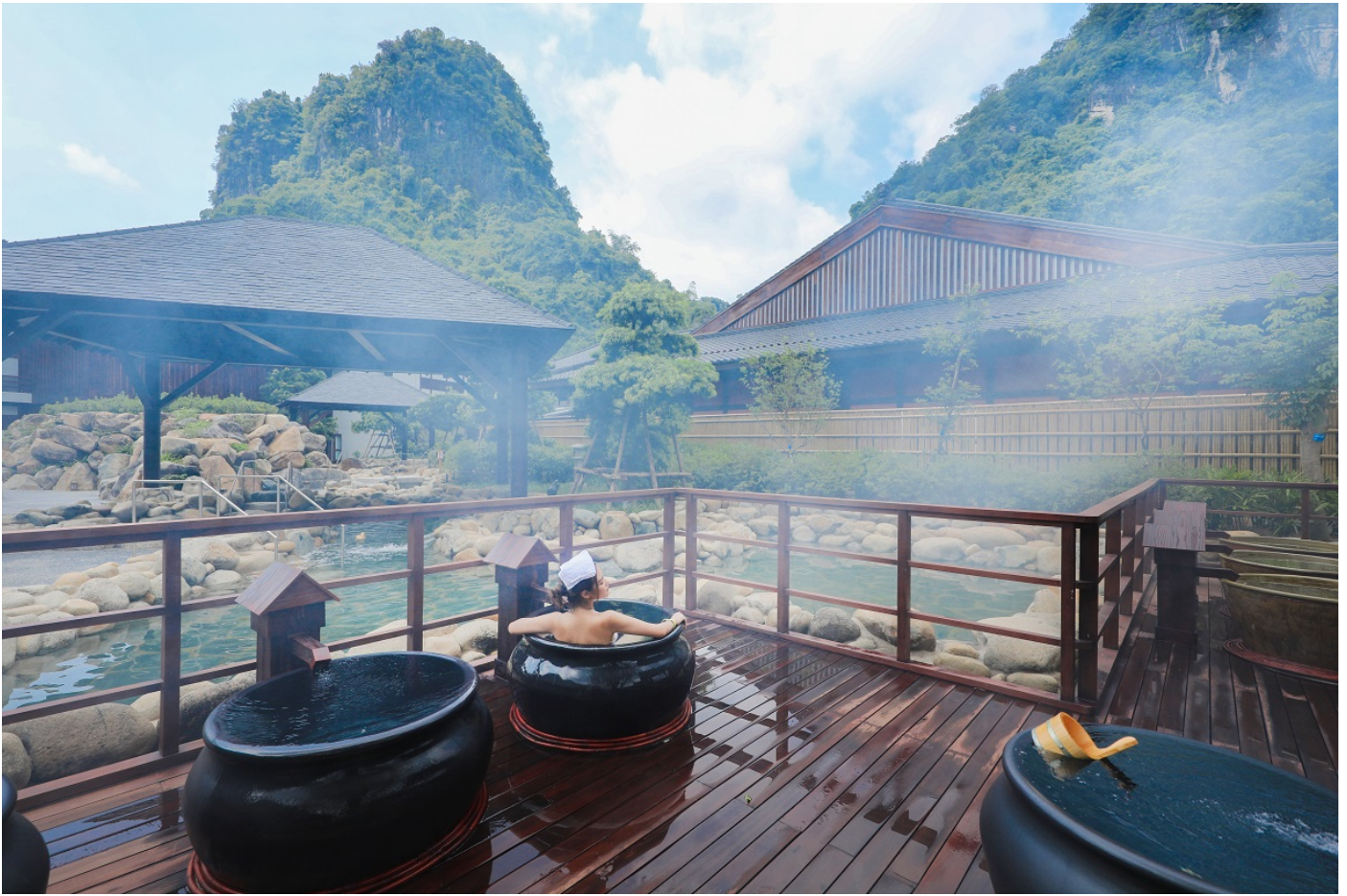
Yoko Onsen Quang Hanh nằm giữa cảnh quan thiên nhiên hùng vĩ

Khách quốc tế đến Vịnh Hạ Long có thể kết hợp nghỉ dưỡng sang trọng, tiện nghi tại khu nghỉ Oakwood Ha Long, tắm suối khoáng nóng và spa tại Yoko Onsen Quang Hanh, ghé thăm làng chài nổi Vung Viêng, lặn tắm biển tại Đảo Tuần Châu, trải nghiệm chợ đêm Hạ Long và thăm quan Bảo tàng Quảng Ninh.