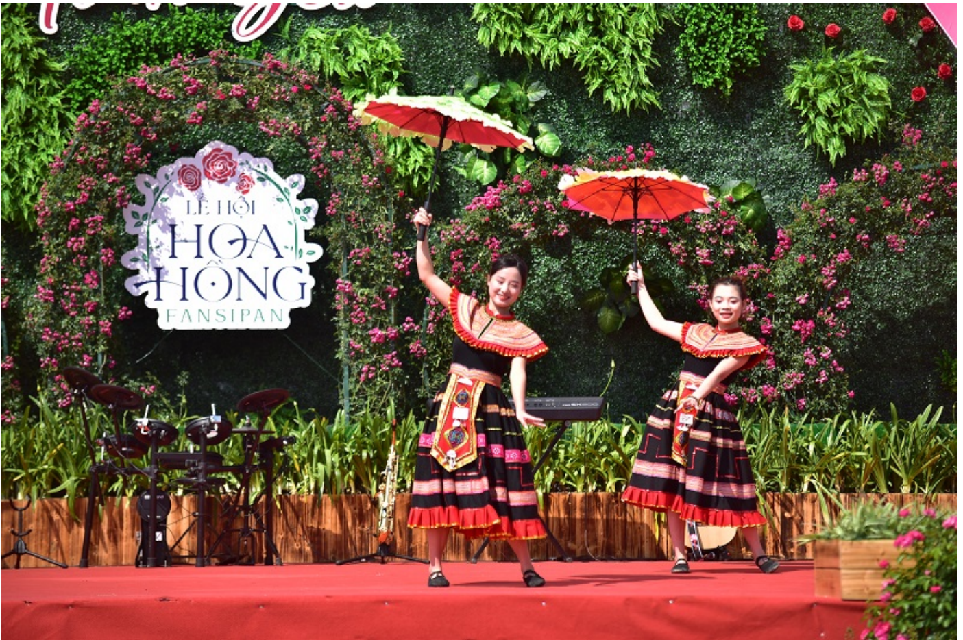
Ngày tại thời điểm này, Lễ hội Hoa hồng Fansipan 2024 với chủ đề “Triệu đóa hồng tình yêu” đang