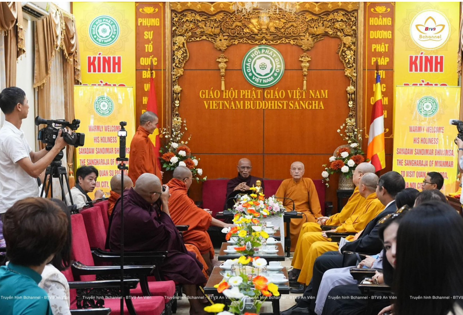
Tăng đoàn Myanmar đã đến thăm và chúc mừng Giáo hội Phật giáo Việt Nam nhân dịp Phật đản PL.2568 - DL. 2024.