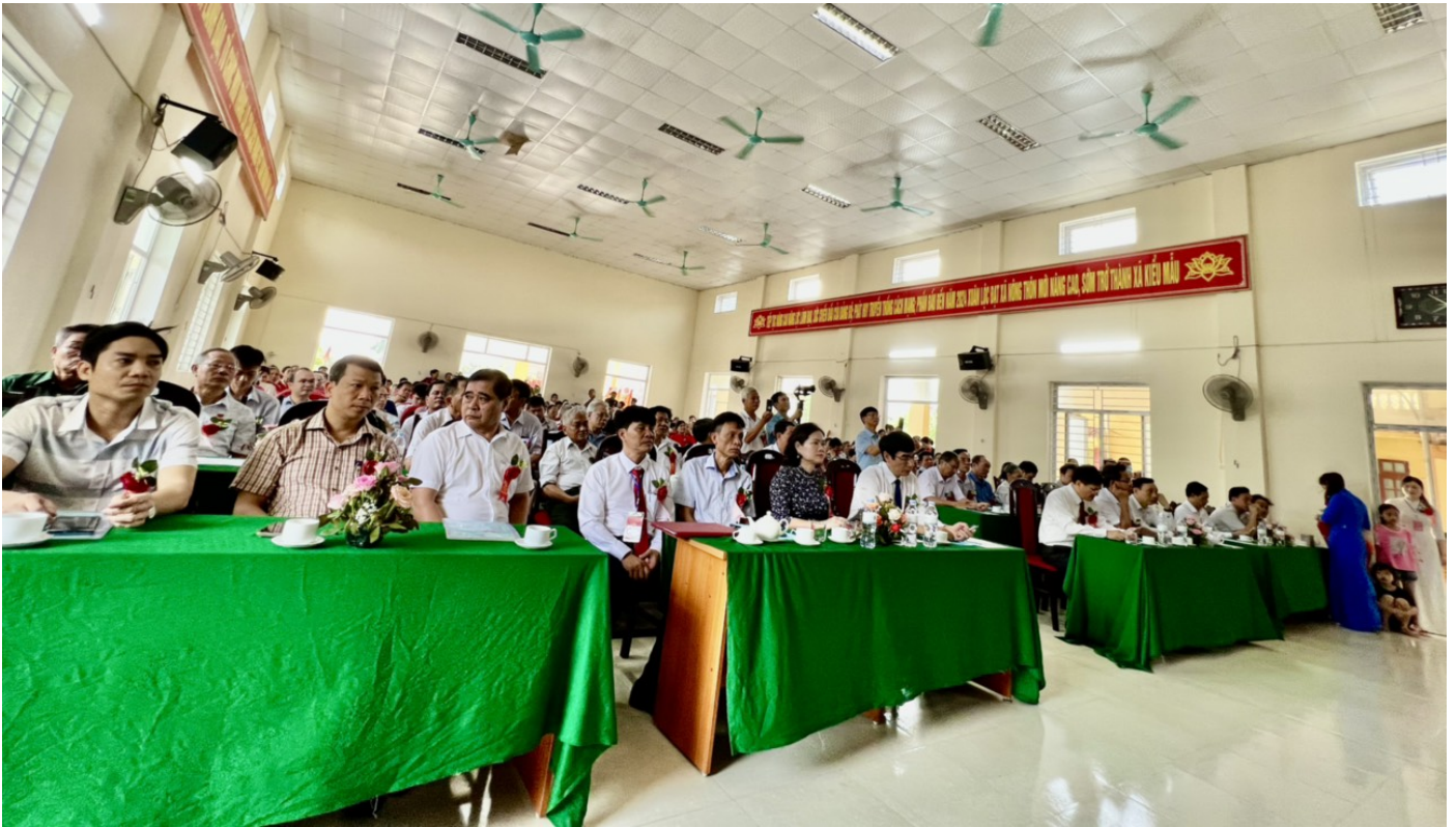
Đại biểu tham dự lễ kỷ niệm

Trong 70 năm qua dưới sự lãnh đạo, chỉ đạo của các cấp, các ban ngành, Đảng bộ xã Xuân Lộc, huyện Hậu Lộc (Thanh Hóa) đã đạt được nhiều thành quả quan trọng trong phát triển kinh tế - xã hội, quốc phòng - an ninh, từ đó đời sống vật chất, tinh thần của người dân không ngừng được nâng cao, bộ mặt nông thôn có sự chuyển biến rõ nét, công tác xây dựng Đảng, xây dựng hệ thống chính trị tiếp tục được tăng cường vững mạnh.