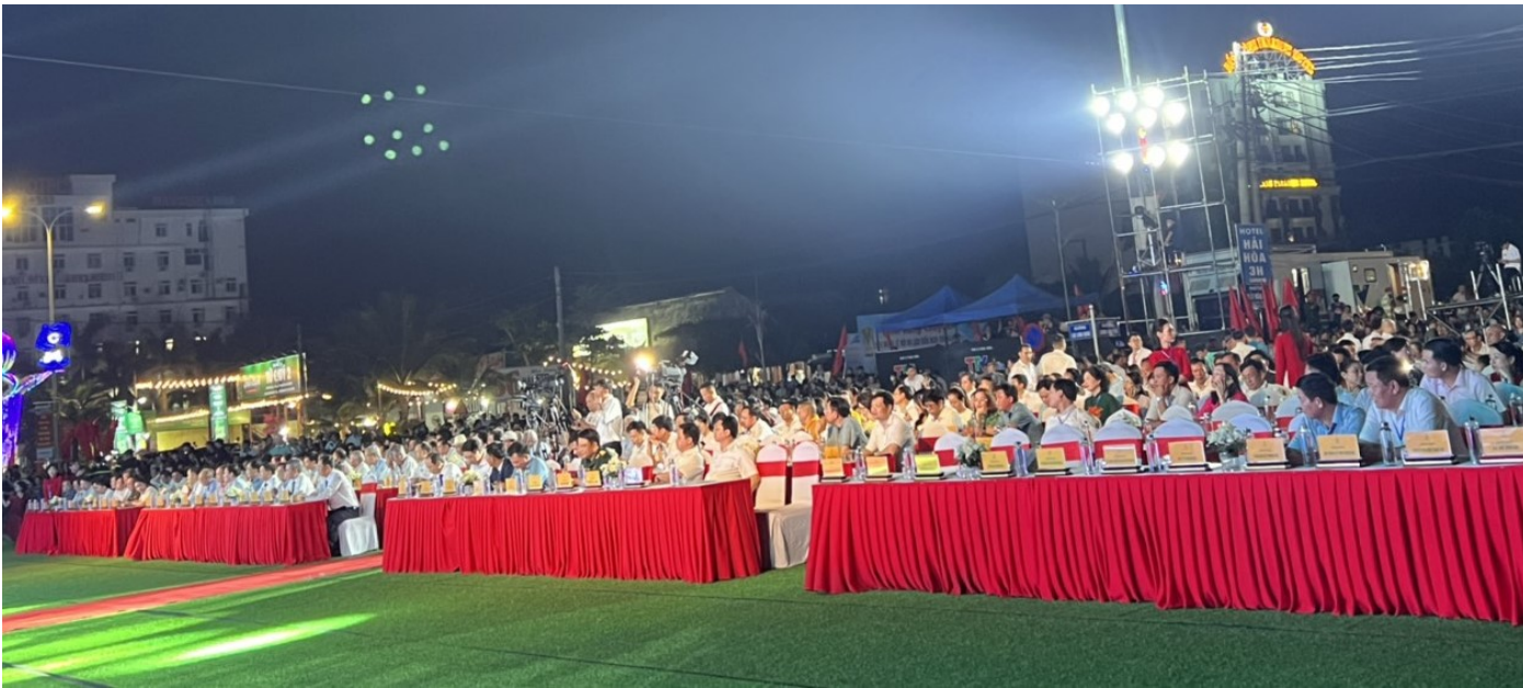
Đại biểu tham dự lễ hội

Ngày 26/4, UBND thị xã Nghi Sơn, tỉnh Thanh Hóa tổ chức khai mạc lễ hội du lịch biển năm 2024 với chủ đề “Nghi Sơn biển ngọc, khát vọng vươn xa”, khai mạc Hội chợ trưng bày, quảng bá, giới thiệu sản phẩm OCOP và nhiều sự kiện văn hóa, thể thao quan trọng khác.