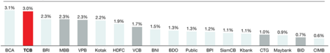
2019-23 Average ROAA

Techcombank liên tục là Ngân hàng có hiệu suất kinh doanh hàng đầu trong khu vực Đông Nam Á&Ấn Độ (nguồn S&P Capital IQ, tháng 2/2024).