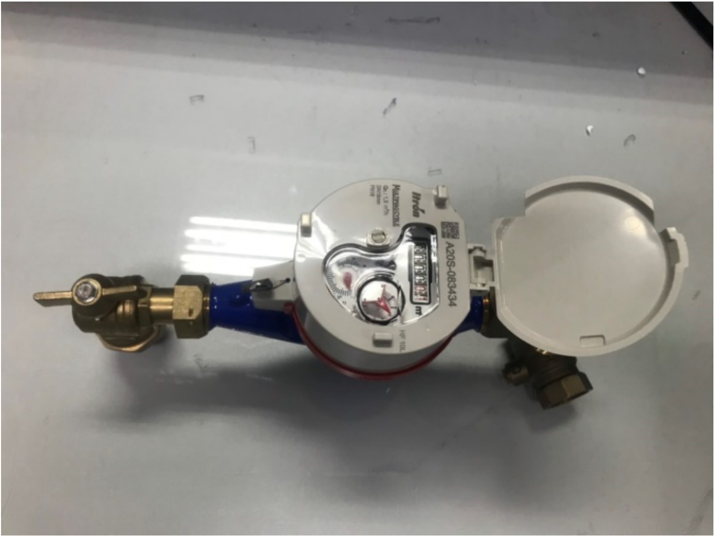
Mở nắp mặt số đồng hồ nước