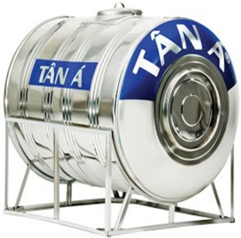
Các loại bồn chứa nước trên sân thượng hoặc mái nhà.