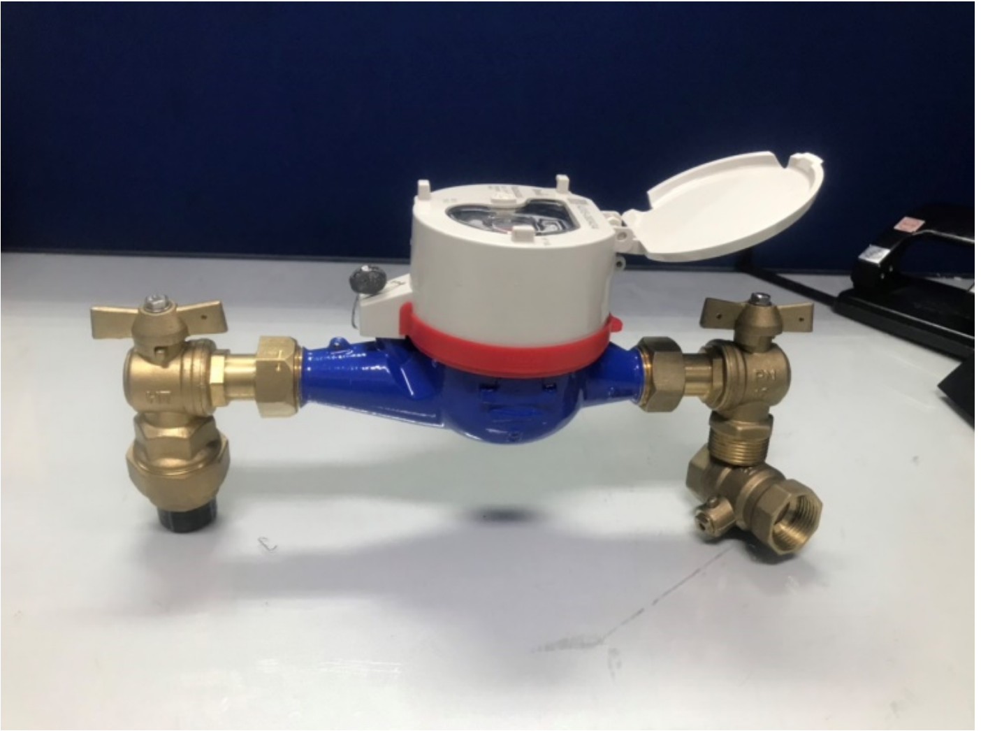
Dạng đồng hồ không có hộp bảo vệ

Bước 2: Đóng hết các van, vòi nước, thiết bị sử dụng nước trong suốt quá trình kiểm tra.