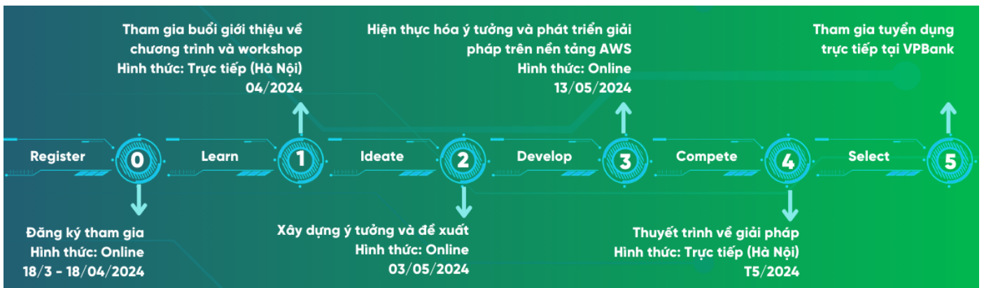
Các mốc thời gian của VPBank Technology Hackathon 2024.

Năm 2023, VPBank ký kết hợp tác chiến lược với AWS và phối hợp tổ chức thành công Hội thảo VPBank Cloud Technology Connect Day, thu hút sự tham dự của gần 200 kỹ sư CNTT cùng rất nhiều chuyên gia hàng đầu trong lĩnh vực điện toán đám mây và trí tuệ nhân tạo (AI). Sự kiện gồm hai hoạt động chính là AWS GameDay with VPBank (Thi đấu công nghệ) và hội thảo Learn & Networking, mang đến trải nghiệm thú vị, giúp người tham gia tiếp cận thêm nhiều kỹ năng, kinh nghiệm về điện toán đám mây và trí tuệ nhân tạo AI.