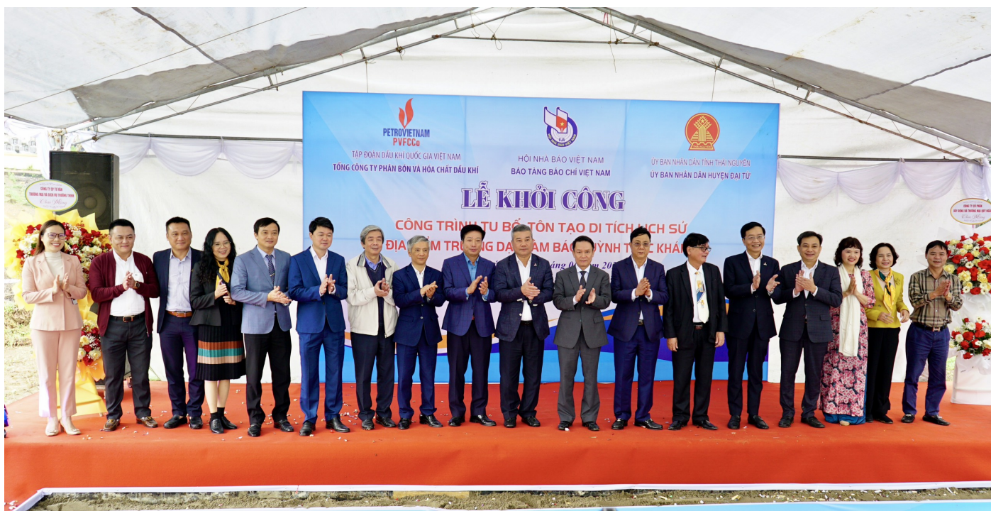
Các đại biểu chụp ảnh lưu niệm, kết thúc buổi lễ.

Đồng thời bày tỏ tin tưởng rằng, trong tương lai không xa với vị thế của Di tích lịch sử quốc gia và sự hình thành phát triển của khu du lịch quốc gia hồ Núi Cốc trên địa bàn xã Tân Thái, huyện Đại Từ sẽ tạo nên một tổng thể hài hoà về văn hoá và du lịch. Đồng chí cũng đề nghị, các cấp, các ngành, địa phương và nhân dân tạo những điều kiện thuận lợi nhất để công trình hoàn thành đúng tiến độ.