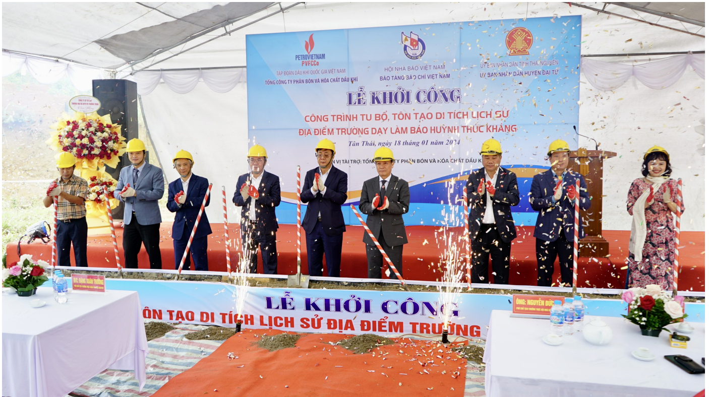
Các đại biểu thực hiện nghi lễ động thổ xây dựng công trình.

chuẩn bị, với quyết tâm rất cao của lãnh đạo Hội Nhà báo Việt Nam, sự quan tâm của các cấp ủy chính quyền và nhân dân tỉnh Thái Nguyên và ngành văn hóa, địa chỉ đỏ nơi tổ chức Trường dạy làm báo Huỳnh Thúc Kháng đã được khoanh vùng bảo vệ và được Bộ Văn hóa, Thể thao và Du lịch công nhận là di tích quốc gia năm 2019 đúng dịp kỷ niệm 70 năm thành lập trường.