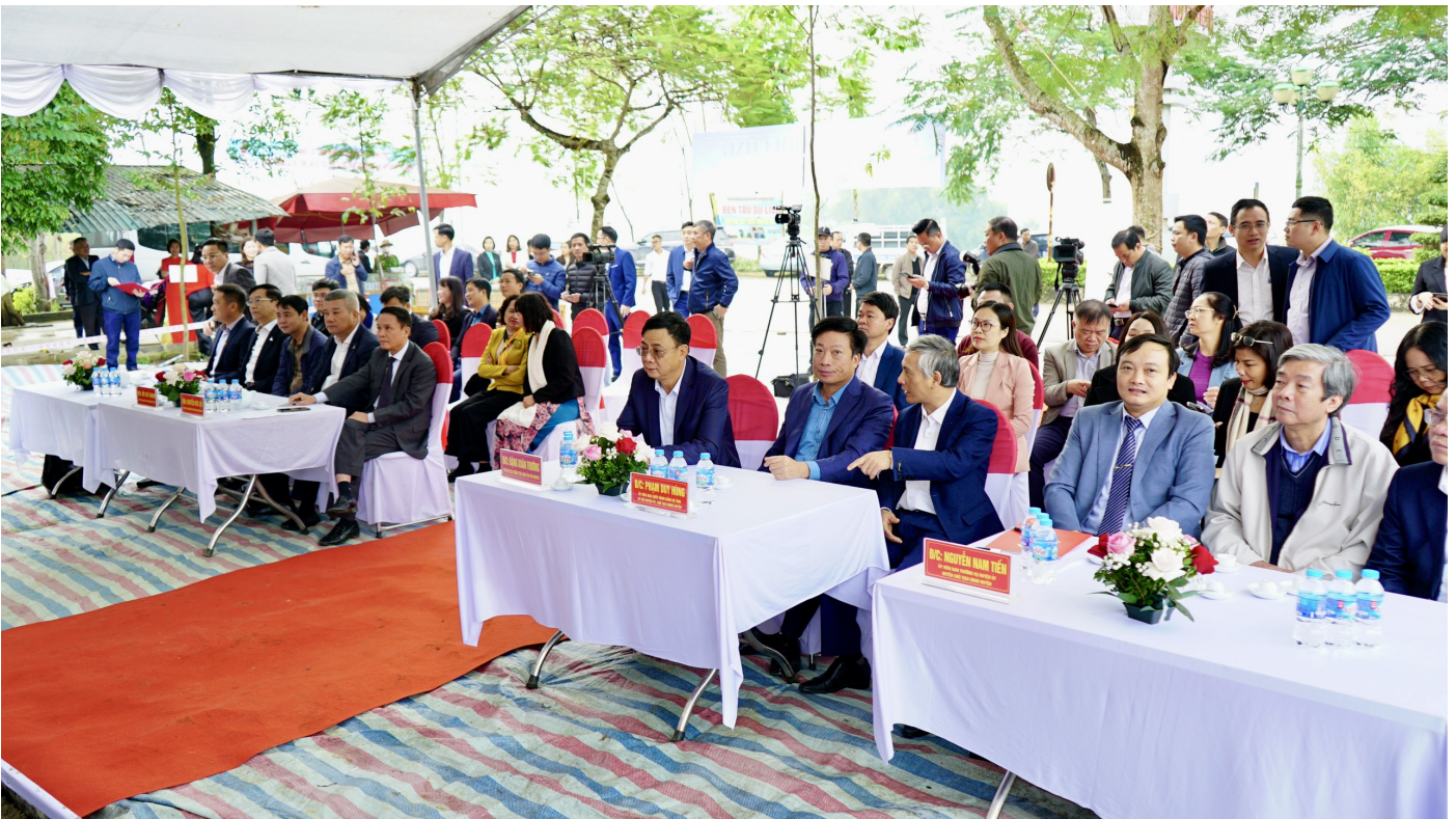
Các đại biểu tham dự lễ khởi công.