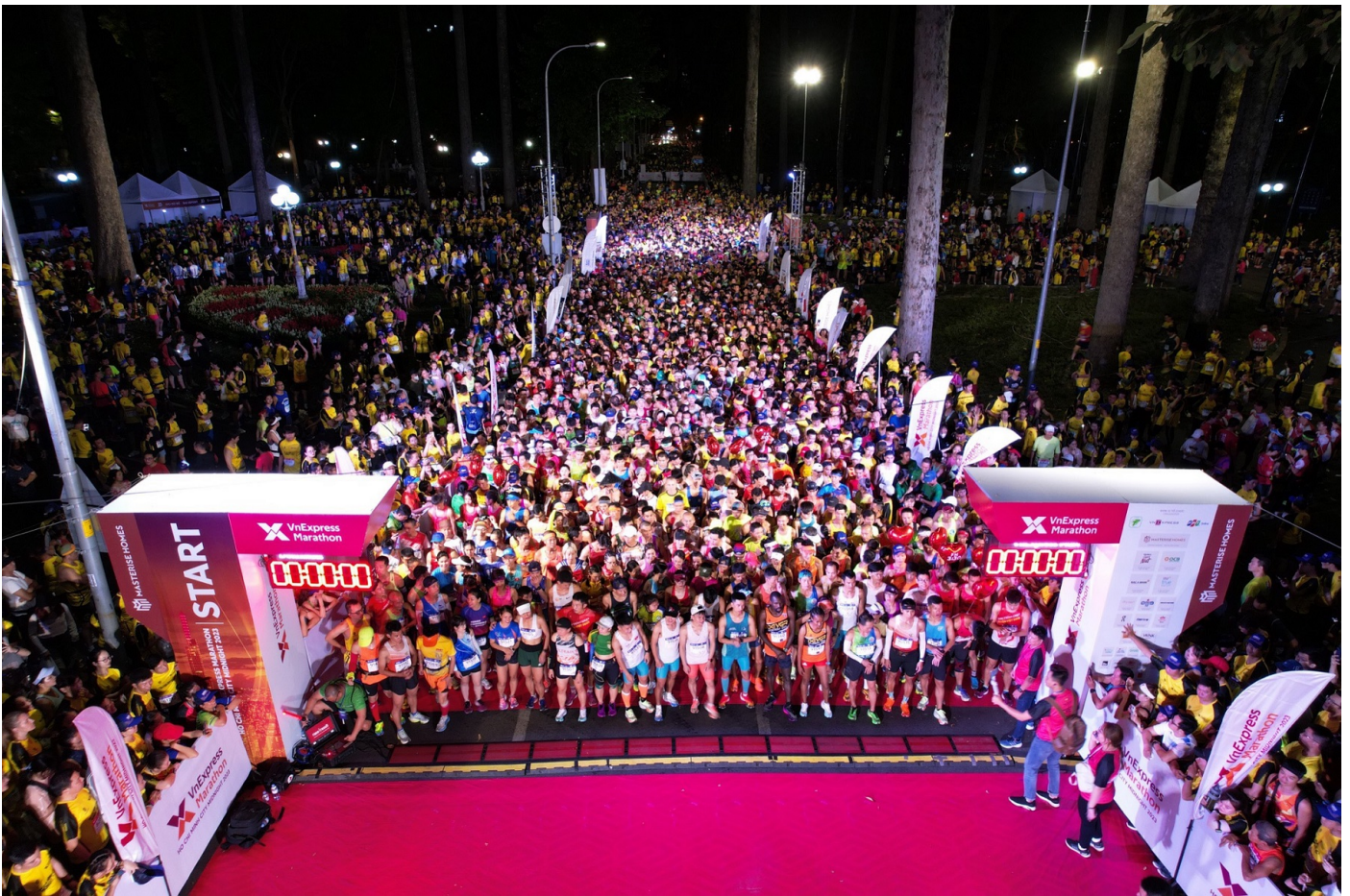
VnExpress Marathon Hồ Chí Minh City Midnight 2023.

Đại diện VPBank cho biết, TP. Hồ Chí Minh với nhịp sống năng động, hiện đại là trung tâm kinh tế, tài chính lớn nhất cả nước và cũng là một trong những nơi có phong trào chạy bộ phát triển mạnh nhất Việt Nam. “Tình yêu chạy bộ của người dân thành phố đồng điệu với văn hoá chạy bộ và chiến lược phát triển, lan tỏa phong trào chạy bộ mà VPBank theo đuổi gần một thập kỷ qua với hơn 11 giải chạy đã được ngân hàng tổ chức. Chúng tôi đặt rất nhiều kỳ vọng ở giải chạy VPBank VnExpress Marathon Hồ Chí Minh City Midnight 2024, với niềm tin rằng việc đồng hành cùng VnExpress Marathon sẽ kiến tạo nên những đỉnh cao mới cho phong trào chạy bộ Việt Nam, lan tỏa những giá trị thịnh vượng thể chất, thịnh vượng tinh thần đến với mọi người, mọi nhà, mọi vùng đất, và kiến tạo nên một cộng đồng người Việt yêu thể thao, sống khỏe mạnh và lành mạnh”.