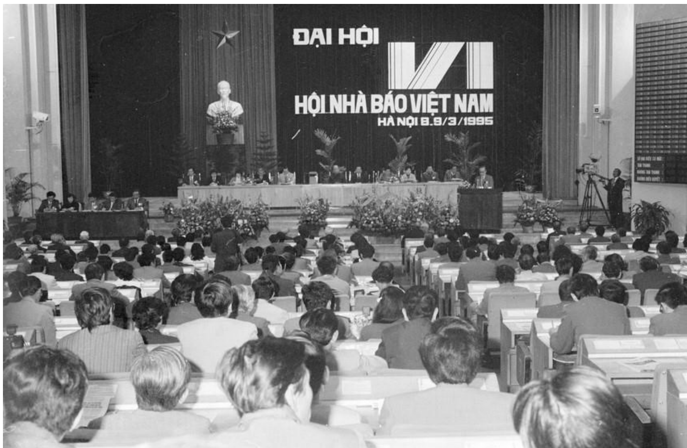
Quang cảnh phiên khai mạc Đại hội lần thứ VI Hội nhà báo Việt Nam diễn ra tại Hà Nội, từ ngày 8-9/3/1995

Trong quá trình lãnh đạo nhân dân tiến hành công cuộc đổi mới đất nước, trong từng giai đoạn, Đảng, Nhà nước ta đã có những bước chuyển quan trọng trong đổi mới tư duy, phong cách và phương thức lãnh đạo, quản lý đối với công tác báo chí. Chỉ thị số 63-CT/TW, ngày 25/7/1990 về tăng cường sự lãnh đạo của Đảng đối với công tác báo chí, xuất bản của Ban Bí thư Trung ương Đảng (khóa VI) đã cụ thể hóa Nghị quyết Đại hội VI của Đảng và được coi là văn kiện quan trọng đầu tiên nêu rõ nội dung, phương thức lãnh đạo của Đảng đối với báo chí. Chỉ thị xác định các công việc mà Đảng, Nhà nước cần thực hiện để lãnh đạo, quản lý báo chí; trách nhiệm của cơ quan chủ quản; trách nhiệm, quyền hạn của người phụ trách cơ quan báo chí và việc thành lập các tổ chức đảng trong các cơ quan báo chí... Ngày 17/10/1997 Bộ Chính trị (khóa VIII) ban hành Chỉ thị số 22-CT/TW về tiếp tục đổi mới và tăng cường sự lãnh đạo, quản lý công tác báo chí, xác định các quan điểm và định hướng, tăng cường thể chế hóa đường lối, nghị quyết của Đảng thành chính sách, pháp luật của Nhà nước trên lĩnh vực báo chí và xuất bản.