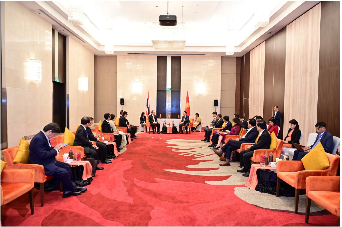
Quang cảnh buổi gặp gỡ và làm việc của Chủ tịch Quốc hội Vương Đình Huệ với Tập đoàn C.P, Công ty Cổ phần Chăn nuôi C.P Việt Nam tại Bangkok, Thái Lan.

Chủ tịch Quốc hội Vương Đình Huệ cũng mong muốn C.P tiếp tục mở rộng đầu tư sản xuất, kinh doanh, chuyển giao kỹ thuật và kinh nghiệm tại Việt Nam theo xu hướng hợp tác chung của 2 nước.