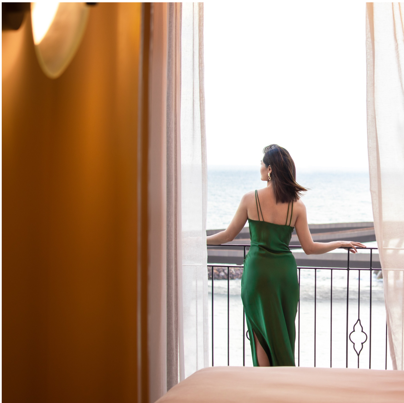
Hương biển hòa trong gió và trời xanh mang sự tươi mới từ ban công La Festa

Nằm tại trung tâm Nam đảo, La Festa Phu Quoc cũng thụ hưởng trọn vẹn hệ sinh thái du lịch hiện đại, tiện nghi của khu vực. Chỉ mất vài phút để đi bộ tới bãi biển tuyệt đẹp và chuỗi nhà hàng Á - Âu, các quán bar và club sôi động ven biển. Trong những ngày lưu trú tại đây, du khách đừng bỏ lỡ trải nghiệm show công nghệ đa phương tiện Kiss Of The Sea, du ngoạn cáp treo Sun World Hon Thom và lưu giữ những khoảnh khắc hoàng hôn ấn tượng với Cầu Hòn.