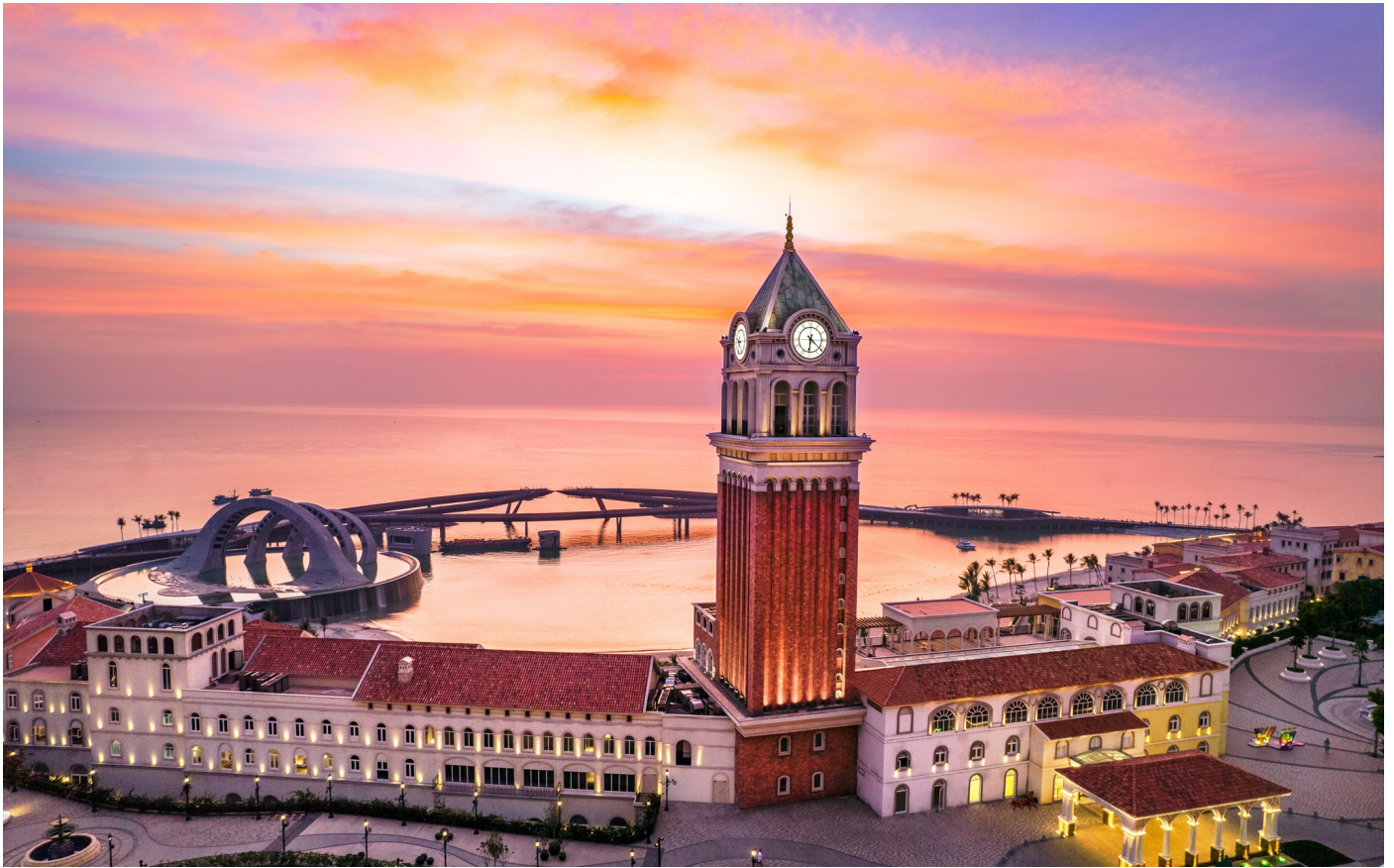
La Festa tọa lạc tại trung tâm Thị trấn Hoàng Hôn, với tầm nhìn rộng lớn về phía biển và Cầu Hôn

Tọa lạc tại trung tâm, được thiết kế đồng nhất với thiết kế tổng thể của Thị trấn Hoàng Hôn - Sunset Town, La Festa Phu Quoc mang trọn nét rung cảm của thị trấn ven biển Amalfi nước Ý và sắc màu lãng mạn của tình yêu. Điều đó được thể hiện qua những gam màu và chất liệu đặc trưng của Amalfi như sắc trắng nổi bật, mái vòm đất nung hồng hay xanh lam, cùng những chi tiết khảm gạch mosaic. Trong 13 hạng phòng khách sạn, văn hóa bản địa Việt Nam cũng được kết hợp hài hòa và tinh tế thông qua những ly gốm sứ, túi và mũ cói được tạo nên bởi những nghệ nhân Việt.