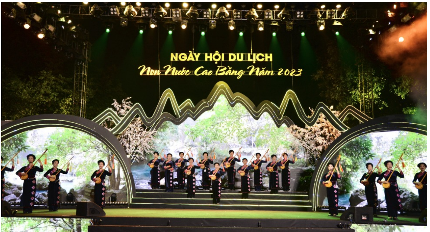
Hấp dẫn ngày hội Du lịch Non nước Cao Bằng năm 2023 tại Hà Nội.

Ngày hội là dịp để Cao Bằng đẩy mạnh công tác quảng bá, giới thiệu với du khách trong nước và quốc tế các sản phẩm du lịch mới, đẩy mạnh hoạt động liên kết, hợp tác phát triển du lịch với các địa phương, doanh nghiệp lữ hành, góp phần bảo tồn văn hóa truyền thống đặc sắc và phát triển du lịch Cao Bằng.