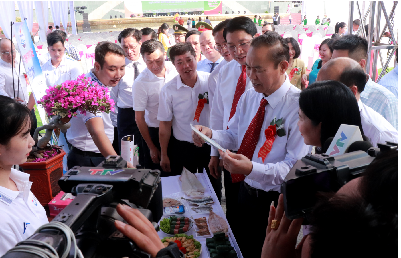
Các đại biểu tham quan gian trưng bày của TP. Sầm Sơn