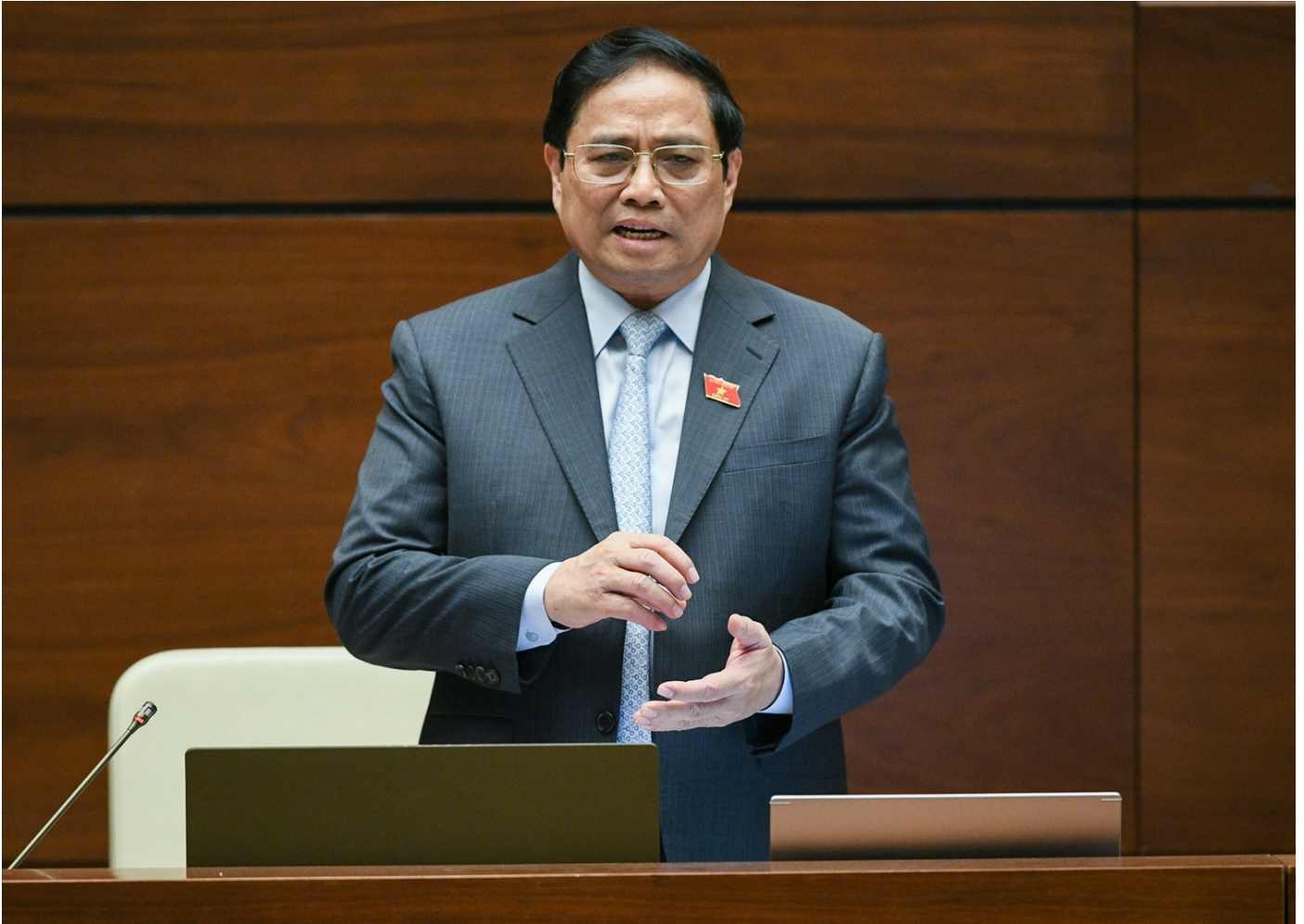
Thủ tướng Chính phủ Phạm Minh Chính trả lời chất vấn tại Quốc hội.

Sau đó, Thủ tướng Chính phủ Phạm Minh Chính sẽ báo cáo giải trình, làm rõ các vấn đề liên quan và trả lời chất vấn của đại biểu Quốc hội.