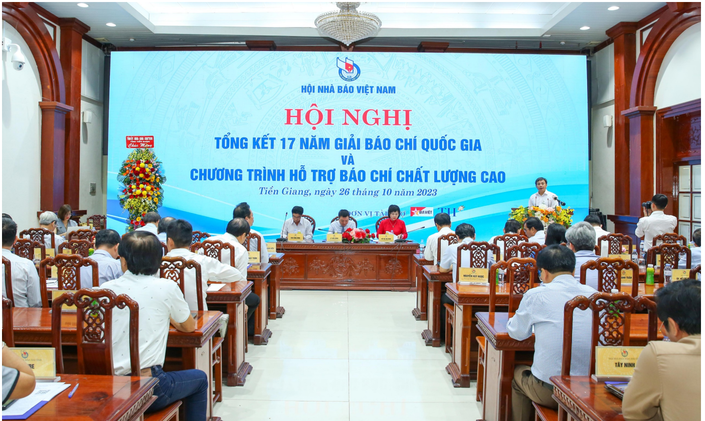
Quang cảnh hội nghị

xuất sắc đã đoạt giải báo chí quốc gia và các giải báo chí chuyên ngành. Qua hội nghị này, tiếp tục khẳng định, Chương trình hỗ trợ báo chí chất lượng cao đã được các cơ quan chuyên môn nghiệp vụ của Trung ương Hội Nhà báo Việt Nam triển khai rất thành công. Trước mắt, Hội Nhà báo Việt Nam ghi nhận các ý kiến và sẽ ban hành các quy định một cách khoa học hiệu quả đến các cấp Hội, đồng thời kiến nghị với Chính phủ, các cơ quan quản lý nhà nước đầu tư mạnh mẽ hơn nữa cho công tác hỗ trợ báo chí chất lượng cao trong giai đoạn tiếp theo.