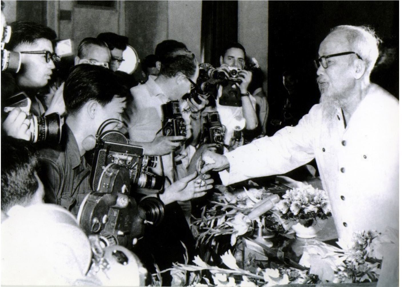
Chủ tịch Hồ Chí Minh tặng hoa nhà quay phim Phan Thế Hùng, xưởng phim vô tuyến truyền hình, nhân Ngày Quốc tế Lao động 1/5/1968

thức rõ con đường duy nhất, đúng đắn nhất đó là con đường giải phóng dân tộc, giải phóng giai cấp và giải phóng đất nước, đưa đất nước đi lên chủ nghĩa xã hội và cùng với đó là sự ra đời báo chí cách mạng Việt Nam để làm phương tiện phục vụ cho cuộc cách mạng vĩ đại đó.