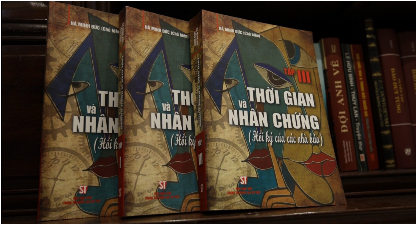
Ảnh bìa bộ sách "Thời gian và nhân chứng"

Sau khi đã đọc hết 43 hồi ký của các nhà báo trong 3 tập sách này, tôi có mấy cảm nhận ban đầu sau đây: