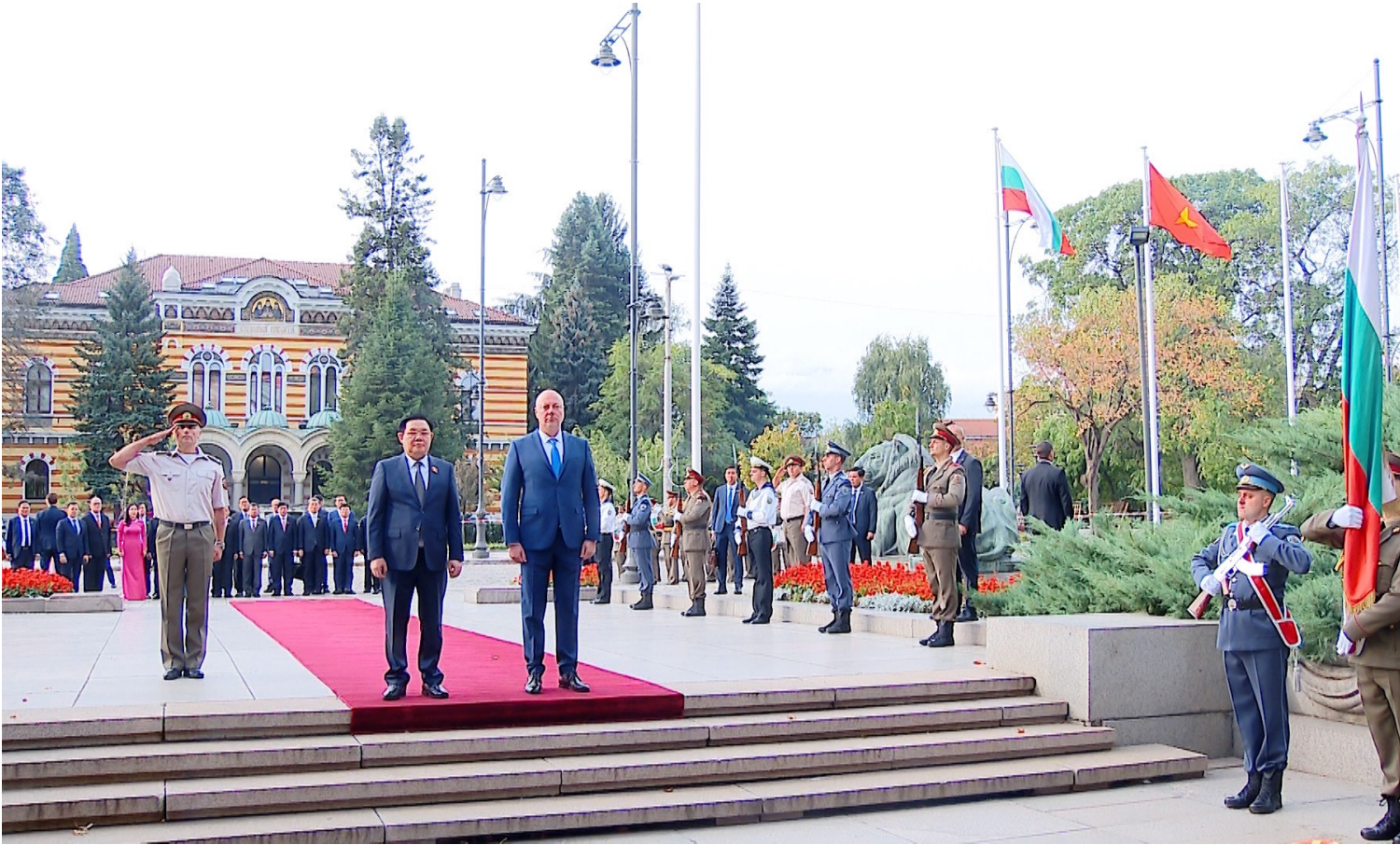
Chủ tịch Quốc hội Bulgaria Rosen Zhelyazkov chủ trì lễ đón trọng thể Chủ tịch Quốc hội Vương Đình Huệ thăm chính thức Bulgaria.