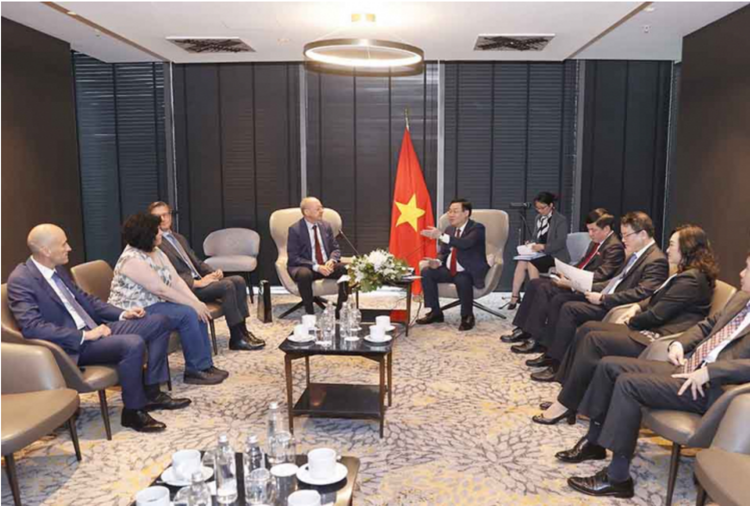
Chủ tịch Quốc hội Vương Đình Huệ tiếp lãnh đạo một số hiệp hội, tập đoàn Bulgaria.

Bulgaria rất ngưỡng mộ các thành tựu phát triển kinh tế, xã hội của chúng ta. Bạn coi chúng ta là hình mẫu phát triển đất nước và rất muốn chúng ta chia sẻ những kinh nghiệm đã vượt qua muôn vàn khó khăn, thử thách kể từ sau khi kết thúc chiến tranh, thống nhất đất nước để trở thành một quốc gia đang phát triển với tốc độ rất nhanh như hiện nay. Các nhà lãnh đạo, đại diện các chính đảng, tổ chức hữu nghị, doanh nghiệp Bulgaria đánh giá rất cao việc cùng với phát triển kinh tế, Việt Nam luôn chú trọng các chính sách xã hội, đời sống của nhân dân Việt Nam ngày càng được nâng lên. Điều này khẳng định chủ trương, đường lối của Đảng ta đề ra là rất đúng đắn và sự lãnh đạo tài tình của Bộ Chính trị, Ban Bí thư của Trung ương cũng như cả hệ thống chính trị để có được những kết quả như hiện nay.