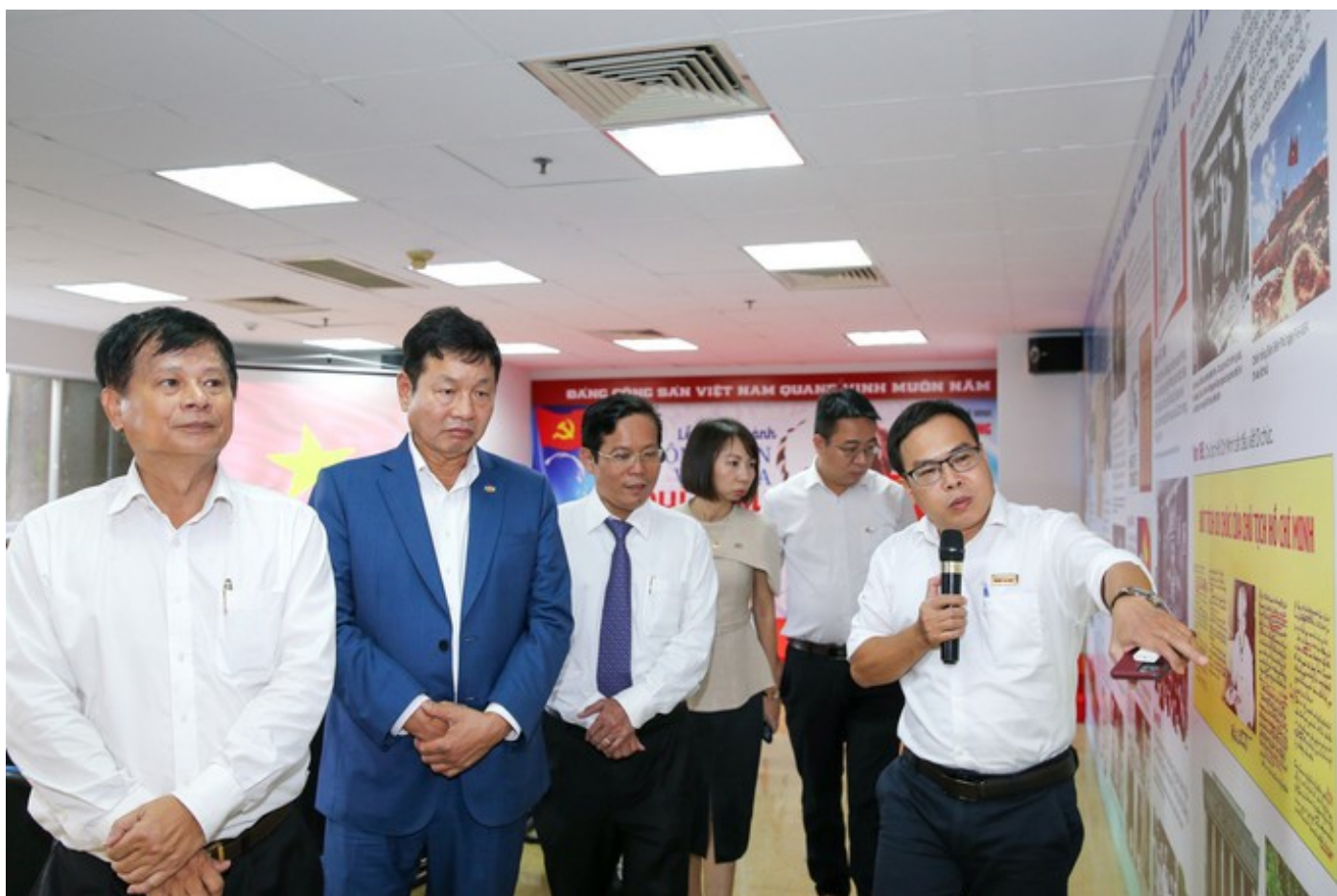
Đoàn tham quan tòa soạn Báo Người Lao Động