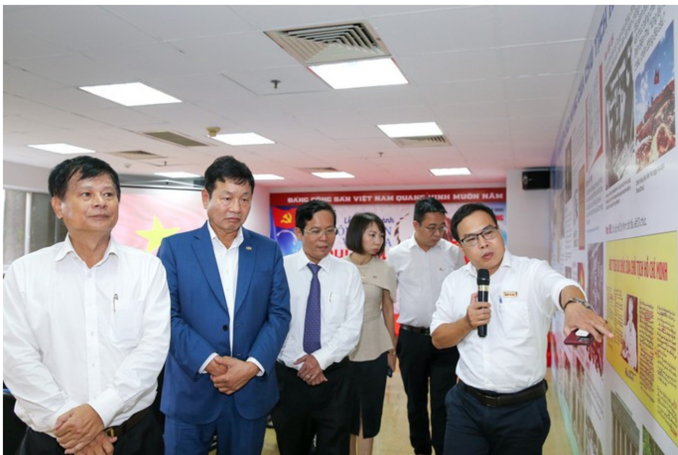
Đoàn tham quan tòa soạn Báo Người Lao Động

Tiếp nối phần trình bày tham luận của các đơn vị, ông Lê Quốc Minh, Ủy viên Trung ương Đảng, Phó Trưởng Ban Tuyên giáo Trung ương, Tổng Biên tập Báo Nhân Dân, Chủ tịch Hội Nhà báo Việt Nam và ông Trương Gia Bình, Chủ tịch Tập đoàn FPT điều phối hoạt động thảo luận với những phần hỏi - đáp cùng các đại biểu tham dự chương trình. Các vấn đề như bản quyền, quảng cáo trên báo chí, giải pháp công nghệ như nền tảng sử dụng chung, công cụ đánh giá, ... được các đại biểu đặt ra với những trăn trở và khó khăn đang đối mặt, từ đó đề xuất mong muốn, giải pháp để sớm khắc phục hạn chế đang tồn tại và thúc đẩy quá trình chuyển đổi số nhanh chóng, đồng bộ.