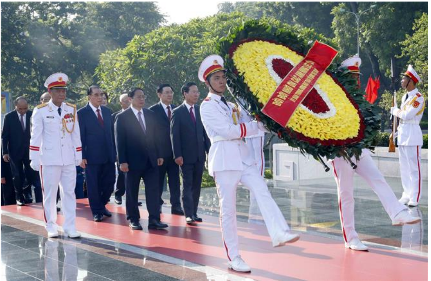
Lãnh đạo Đảng, Nhà nước đến đặt vòng hoa tưởng niệm các Anh hùng liệt sĩ

Với lòng biết ơn vô hạn, các đồng chí lãnh đạo Đảng, Nhà nước đã thành kính tưởng nhớ Chủ tịch Hồ Chí Minh, vị lãnh tụ thiên tài, anh hùng giải phóng dân tộc. Vòng hoa của đoàn mang dòng chữ "Đời đời nhớ ơn Chủ tịch Hồ Chí Minh vĩ đại". Cách đây 78 năm, ngày 2/9/1945, tại Quảng trường Ba Đình lịch sử, Chủ tịch Hồ Chí Minh đã đọc bản Tuyên ngôn Độc lập, khai sinh ra nước Việt Nam Dân chủ Cộng hòa, nay là nước Cộng hòa xã hội Chủ nghĩa Việt Nam.