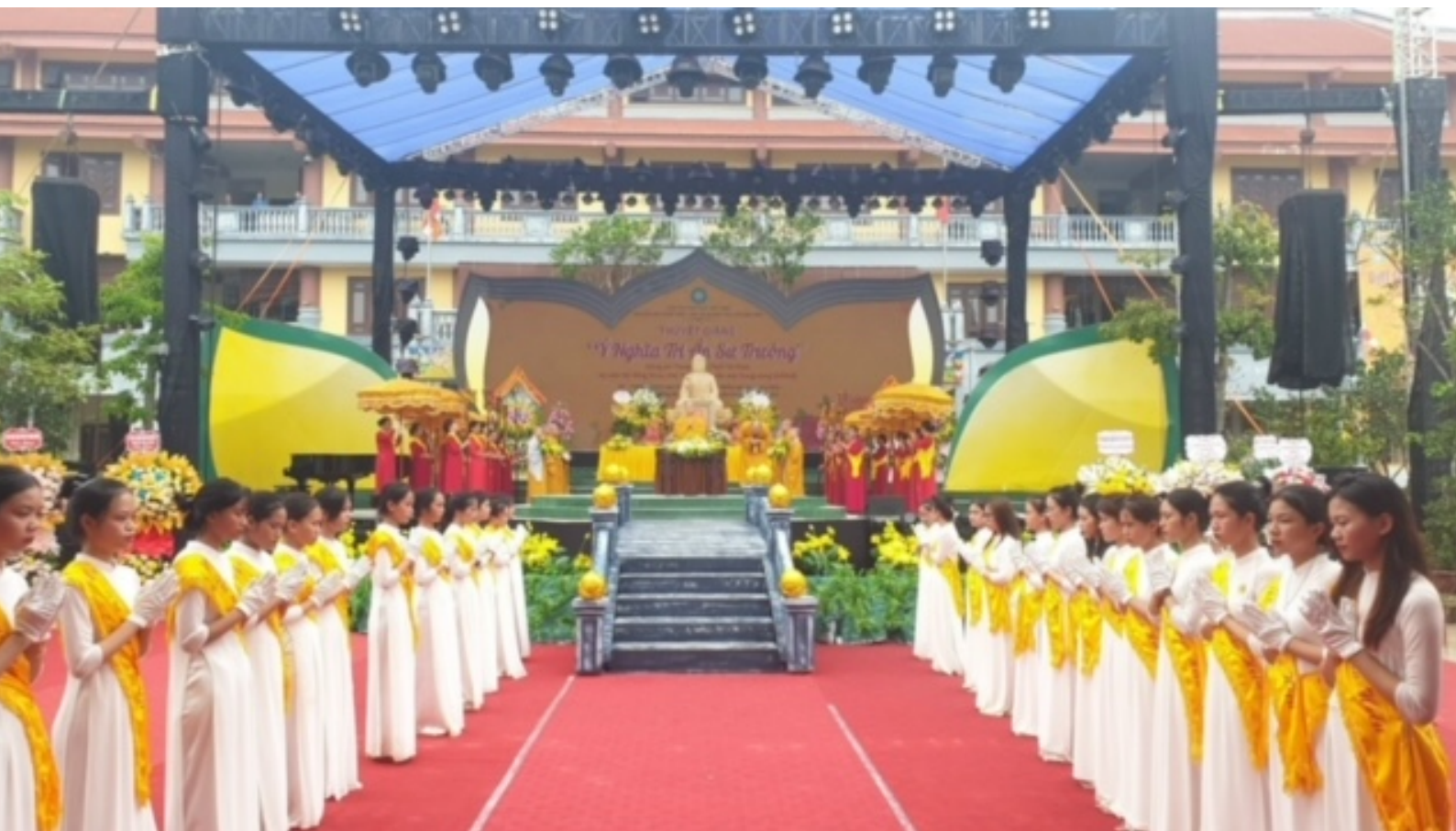
Toàn cảnh lễ hội tri ân mùa Vu Lan báo hiếu.