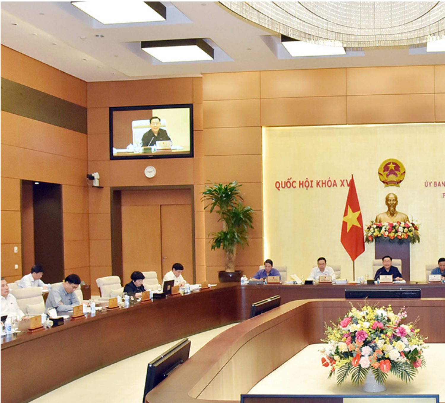
Quang cảnh phiên họp.