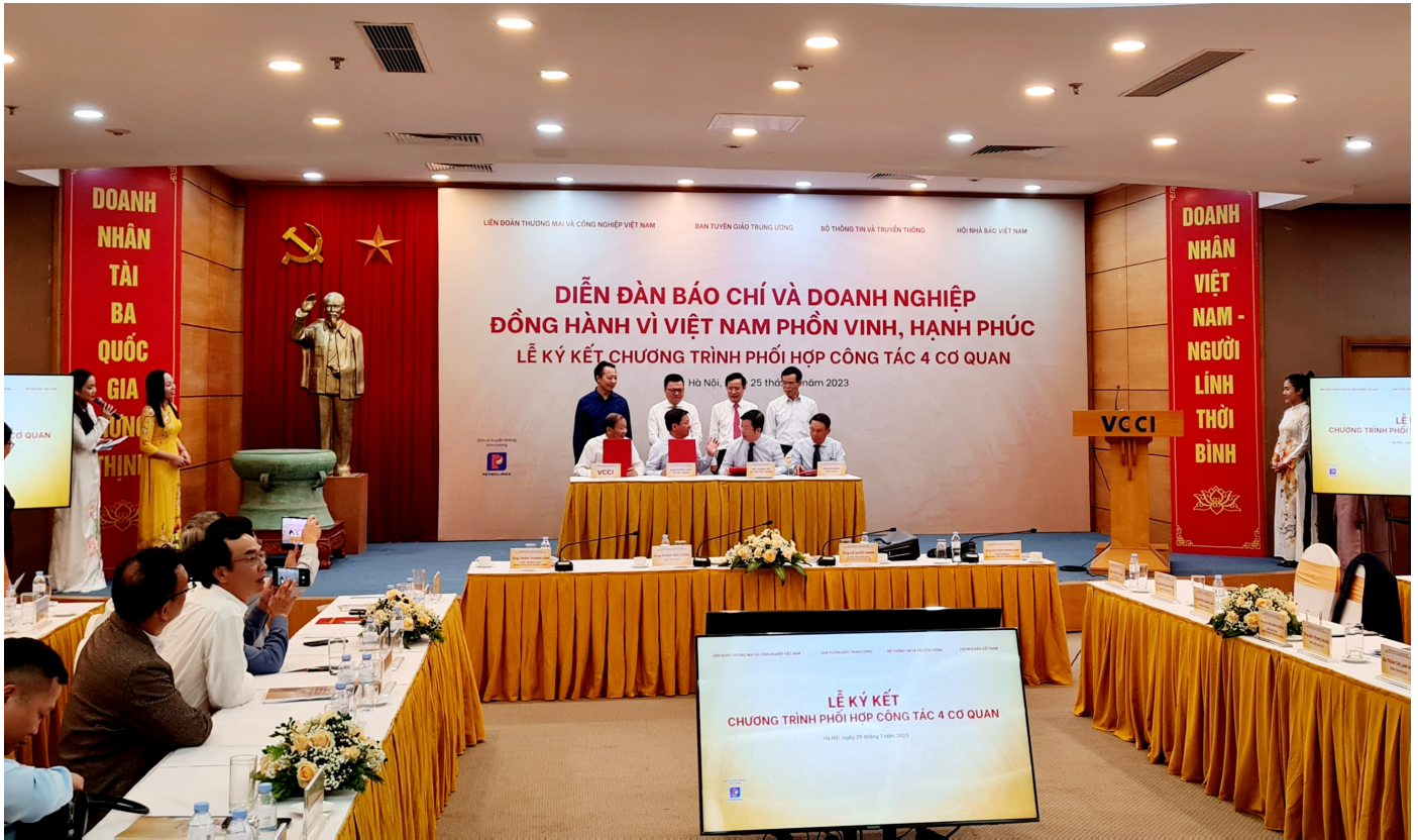
Lễ ký kết chương trình phối hợp công tác tại diễn đàn báo chí và doanh nghiệp đồng hành vì Việt Nam phồn vinh, hạnh phúc.

Báo chí nên tuyên truyền về doanh nghiệp đã có nhiều cống hiến cho đất nước. Các cơ quan báo chí cần phải tăng cường công tác chỉ đạo, định hướng, giáo dục rèn luyện đội ngũ phóng viên, đạo đức trong sáng, xây dựng đội ngũ người làm báo có nhiều tác phẩm báo chí, đóng góp vào sự phát triển kinh tế đất nước. Mỗi chiến sĩ là một mặt trận, trong đó doanh nhân là chiến sĩ đi đầu trên mặt trận kinh tế”.