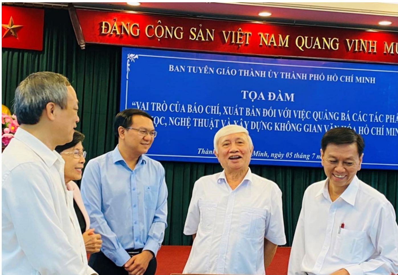
Các đại biểu trao đổi kinh nghiệm với nhau.

Phó Trưởng Ban Tuyên giáo Thành ủy Thành phố Hồ Chí Minh đề nghị, các cơ quan báo chí cần có sự cân bằng trong các thể loại bài viết, ưu tiên những bài giới thiệu, cổ vũ cho văn hóa nghệ thuật truyền thống nhằm bảo tồn, phát huy những tài sản vô giá của văn hóa nghệ thuật mà ông cha đã trao truyền; ưu tiên những bài viết giới thiệu, cổ vũ những loại hình nghệ thuật âm nhạc hàn lâm nhằm góp phần từng bước nâng cao dân trí... Đặc biệt, cần đẩy mạnh công tác tuyên truyền, quảng bá tác phẩm văn học nghệ thuật để có thể lan tỏa nhanh, mạnh trên các phương tiện truyền thông, qua đó góp phần giới thiệu, quảng bá về một thành phố năng động, nghĩa tình, giàu bản sắc.